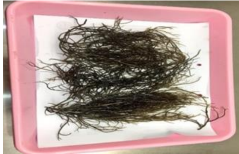
Gambar 2: Alga Gracillaria sp. (Dokumentasi Pribadi, 2019)

fase eksponensial, selain itu pada waktu inkubasi diatas 20 jam, bakteri-bakteri lain (bakteri susu) mulai muncul dan terkontaminasi media, sehingga dapat mengganggu pengamatan.