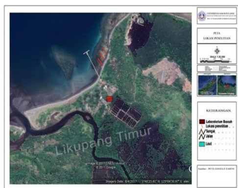
Gambar 2. Peta Lokasi Penelitian

Penelitian ini dilakukan di Perairan Kampung Ambong Kecamatan Likupang Timur, Kabupaten Minahasa Utara dan penelitian ini telah dilakukan pada tanggal 9-10 juni 2017.