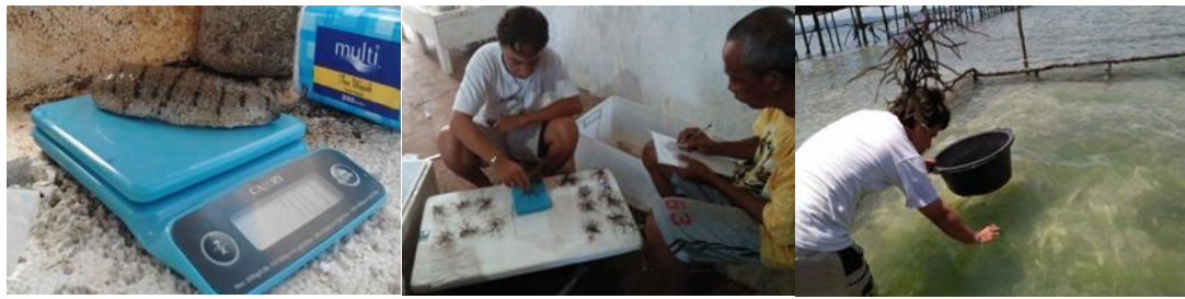
1a 1b 1c Gambar 1. Pengukuran dan Penebaran Objek Penelitian