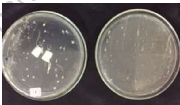
Gambar 2. Bakteri simbiosis alga merah yang tumbuh pada media agar

alga merah mirip Gracilaria sp. berjumlah 5 isolat juga. Masing-masing isolat bakteri memiliki karakteristik morfologi yang berbeda dan dapat dilihat pada tabel 1. Karakteristik koloni bakteri yang diamati meliputi bentuk, warna, elevasi, dan tepian (Dwijoseputro, 1989).