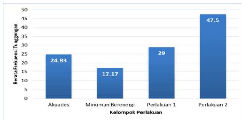
Gambar 1. Grafik Jumlah Rata-rata frekuensi tunggangan (kawin) selama 7 hari Keterangan: (Akuades), (Minuman berenergi), (P1 air rebusan akar ilalang 9 mL/kg BB), (P2 air rebusan akar ilalang 18 mL/kg BB)

Hasil pengamatan rerata berat badan menunjukkan, pemberian rebusan air akar ilalang tidak meningkatkan rerata berat badan dibandingkan kelompok kontrol (Gambar 2). Hasil ini berbeda dengan pemberian minuman berenergi yang meningkatkan berat badan mencit jantan kelompok kontrol positif. menunjukkan perlakuan menggunakan minuman berenergi memiliki rata-rata kenaikan berat badan paling tinggi yaitu 33 gram sedangkan aquades, rebusan akar ilalang 9 mL/kg BB dan air rebusan ilalang 18 mL/kg BB hanya 31 gram.