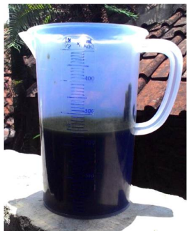
Gambar 2. Minyak Plastik Hasil Pirolisis

maka reaksi pembentukan molekul yang lebih kecil juga meningkat.