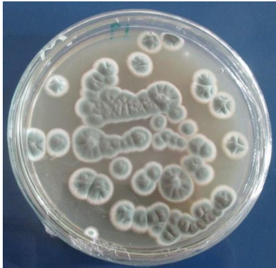
Gambar 2. Hasil pemurnian cendawan entomopatogen asal kecoa ( P. americana ) pada media PDA.

Hasil isolasi cendawan entomopatogen asal kecoa yang telah dilakukan didapatkan satu genus cendawan entomopatogen (kode P2) yang termasuk dalam genus Penicillium .