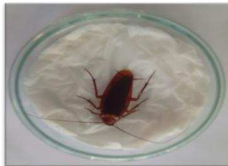
Gambar 1. Isolasi cendawan entomopatogen menggunakan metode Moist Chamber

Cendawan yang tumbuh pada tubuh kecoa dimurnikan menggunakan media PDA. Selanjutnya cendawan yang mempunyai warna yang berbeda di inokulasikan kedalam media PDA menggunakan ose jarum. Lalu diinkubasi pada suhu 25-28°C selama 7 hari diinkubator. Pemurnian dilakukan sampai mendapatkan cendawan yang hanya mempunyai satu warna.