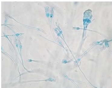
Gambar 3. Hasil pengamatan mikroskopis Penicillium sp.

Berdasarkan hasil pengamatan secara makroskopis, menunjukkan adanya koloni cendawan dengan ciri – ciri sebagai berikut: koloni cendawan yang berwarna abu-abu. Sedangkan berdasarkan pengamatan secara mikroskopis, terlihat ciri- ciri koloni cendawan mempunyai konidia yang berbentuk: koloni bulat atau globose, konidiofor mempunyai cabang, mempunyai hifa bersekat, tidak mempunyai vesikel dan sel kaki, mempunyai fialid tunggal yang dapat dilihat pada (Gambar 3).