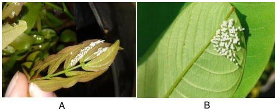
Gambar 1. Telur pada tanaman pakan larva yang di letakkan di permukaan bawah daun (A. Kaliandra, B. Ketepeng)

Perbedaan pola peletakkan telur pada kedua tanaman pakan diduga karena ukuran panjang daun, lebar daun, dan luas daun berbeda. Tanaman kaliandra mempunyai daun majemuk yang berpasangan dengan jumlah daun 20 pasang memiliki panjang 4-6 cm dan lebar daun 2-6 cm (Tangendjaja et al , 1992), sedangkan tanaman ketepeng mempunyai daun majemuk dengan jumlah daun antara 8 hingga 24 pasang memiliki panjang daun antara 3,5-15 cm, dan lebar 2,5-9 cm (Rosdiana, 2015).