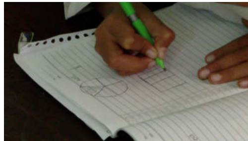
Gambar 2. Contoh representasi sebagai indikator sikap siswa terhadap matematika

Representasi internal suatu konsep merupakan wakil konsep tersebut dalam pikiran siswa. Wakil ini dibutuhkan terutama ketika siswa ingin membicarakan atau mempelajari suatu konsep matematika. Tentu saja, siswa akan mengalami kesulitan dalam belajar atau menyelesaikan masalah-masalah, jika tidak memiliki wakil konsep. Sebagai contoh, siswa akan sulit menjawab kenapa \frac{2}{5} lebih besar dari \frac{1}{5} , jika ia tidak dapat merepresentasikan pecahan-pecahan tersebut dalam bentuk gambar-gambar.