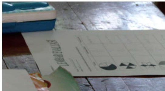
Gambar 1. contoh representasi dalam pandangan brunner

yang lebih tinggi dipengaruhi oleh representasi lainnya. Sebagai contoh, untuk sampai pada pemahaman konsep pecahan untuk siswa SD, dapat diperoleh melalui beberapa pengalaman terkait, misalnya diawali dengan memanipulasi benda kongkrit seperti buah jeruk, apel, roti tar sebagai bentuk representasi enactive. Kemudian aktivitas tersebut diingatnya dan menghasilkan serta memperkaya melalui gambar-gambar (seperti gambar jeruk, gambar apel, gambar bangun bidang datar persegi, persegi panjang, segitiga dan lingkaran) atau persepsi statis dalam pikiran anak yang dikenal sebagai representasi iconic. Dengan mengembangkan berbagai persepsinya, symbol yang dikenalnya dimanipulasi untuk menyelesaikan suatu masalah sebagai perwujudan representasi symbolic 22 .