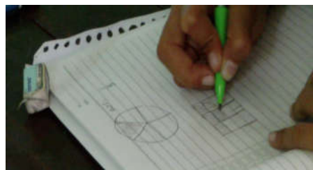
Gambar 4. Contoh representasi merupakan proses pengembangan yang berada dalam kontinum prosedural – konseptual

Menurut model RR, pada fase prosedural, siswa lebih berorientasi pada hasil dan menunjukkan kinerja algoritma mereka. Pada fase meta prosedural, sifat representasi berbeda dengan fase sebelumnya. Siswa menunjukkan konstruksi meta prosedural, sebagai contoh interpretasi dari algoritma dan rasionalisasi dari prosedur tersebut. Pada tingkat 3, mereka menunjukkan kontrol atas kontinum eksternal-internal dimana re-presentasi diatur dalam jaringan mental siswa. Sebagai contoh, siswa dapat menyatakan situasi masalah dalam bentuk-bentuk apa yang ditanyakan, proses apa yang digunakan, dan apa kemungkinan solusi yang melibatkan konsep-konsep dalam masalah.