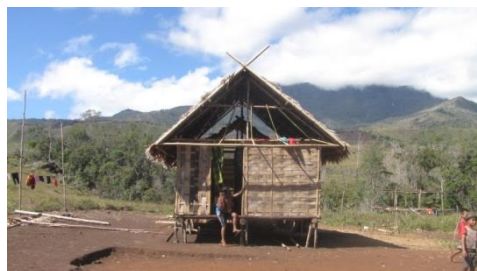
Gambar 1. Rumah Orang Wana

Namun pada suku Wana, ada juga faktor lain turut berpengaruh. Di suku ini bila ada penghuni rumah yang meninggal dunia maka mereka akan membongkar rumah yang mereka tinggali dan berpindah jauh dari situ. Ini merupakan salah satu kebiasaan mereka sehingga turut berkontribusi terhadap pola hidup mereka yang berpencar dan berpindah-pindah.