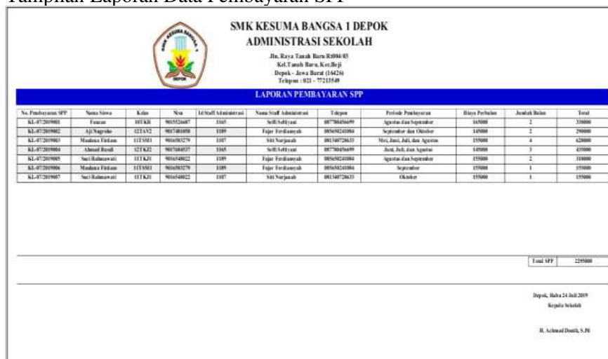
Gambar 11. Tampilan Laporan Data Pembayaran SPP