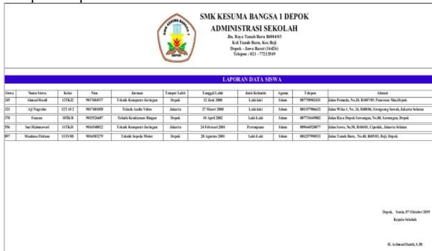
Gambar 10. Tampilan Laporan Data Siswa