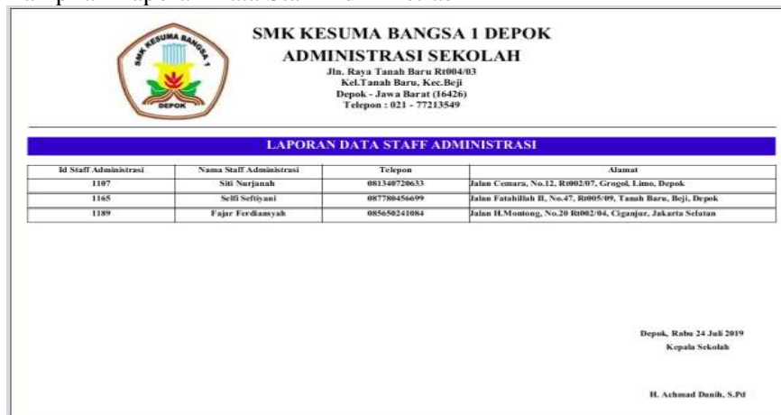
Gambar 9. Tampilan Laporan Data Staff Administrasi