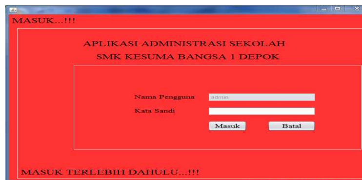
Gambar 1. Tampilan Masuk