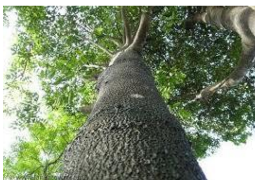
Gambar 2. Kayu Hitam ( Diospyros sp )

Selain itu, ada sebanyak 114 jenis tumbuhan langka dan terancam punah. Jenis-jenis tersebut antara lain kasturi ( Mangifera casturi ), kibatalia ( Kibatalia wigmanii ), tiga jenis eboni (salah satunya eboni sulawesi, Diospyros celebica ), pala hutan ( Myristica kjellbergii ), dan tiga jenis pohon penghasil gaharu (salah satunya Aquilaria beccariana ).