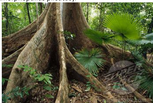
Gambar 1. Woka ( Livistonia rotundifolia )

( Diospyros minahassae ), meranti sulawesi ( Vatica celebica ), pala hutan minahasa ( Myristica minahassae ) dan bunga bangkai sulawesi ( Amorphopallus plicatus ).