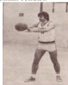
Gambar 1: Bentuk Pelaksanaan Chest pass (Ambler, 1982:24-29).

Berdasarkan kutipan-kutipan di atas, dapat dikemukakan bahwa kemampuan passing dada ( chest pass ) merupakan salah satu kemampuan teknik dasar passing dalam permainan bolabasket yang penting peranannya untuk mengatur tempo permainan, mengadakan serangan balik, melewati lawan serta membuat kesempatan untuk melakukan tembakan dan dapat menjaga bola tetap berada di pihak sendiri.