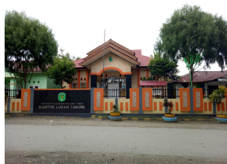
Kantor Lurah Tomoni

Kelurahan Tomoni yang terletak di sebelah utara berbatasan langsung dengan Kecamatan Mangkutana di sebelah utara. Sebelah timur berbatasan dengan Desa Bangun Jaya. Sebelah selatan berbatasan dengan Desa Mulyasari dan sebelah barat berbatasan dengan Desa Mandiri. Kelurahan Tomoni terdiri atas empat Lingkungan dan sembilan RT. Wilayah Kelurahan Tomoni secara topografi wilayah yang sebagian besar merupakan daerah datar. Terdapat satu sungai yang mengalir Kelurahan Tomoni yang merupakan batas dengan Kecamatan Mangkutana yaitu Sungai Tomoni. Masyarakat yang mendiami kawasan ini kebanyakan bermata pencaharian sebagai pedagang, tetapi ada pula yang bekerja sebagai petani, PNS, karyawan toko, mini market, karyawan bank, warung makan dan lain-lain.