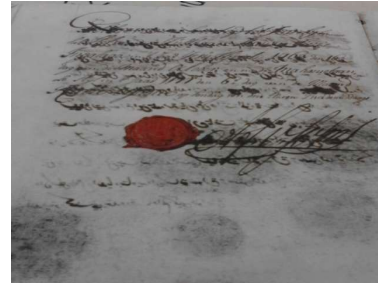
Gambar 4. Kontrak Perdagangan Lada Pangeran Dipati Anom dan Pieter Soury.

ada dalam arsip yang tersimpan di Arsip Nasional Republik Indonesia.