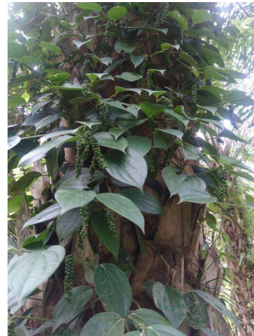
Gambar 4. Lada ditanam di lahan kelapa sawit.

kan banyak hasil. Pada akhir abad XVIII, lada Jambi dianggap bermutu rendah. Pada abad XIX, pedagang Nusantara tidak lagi berlabuh di Jambi (Scholten, 2008: 45).