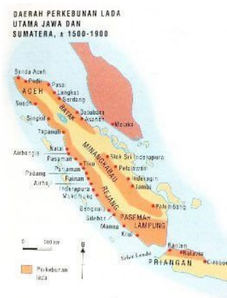
Gambar 1. Daerah perkebunan Lada di Sumatra dan Jawa

Pada abad ke-17, lada tumbuh sebagai komoditas perdagangan paling menguntungkan yang didatangkan Kepulauan Nusantara (Banten dan Sumatra) ke Cina. Memasuki abad ke-16, perdagangan lada di Cina bergeser ke Pelabuhan Banten (Soedewo, 2007:18). Dalam tulisannya itu, Soedewo menyebutkan, pada masa itu, Banten menjadi pusat perdagangan Asia. Setiap tahun sekitar 1.500 ton lada diekspor dari Banten ke Cina. Selain ke Cina, negara-negara Eropa secara rutin juga mengimpor lada dari Banten rata-rata 3.000 ton per tahun. Lada pertama kali dibawa para pedagang Arab dan Persia dan kemudian ditanam di sekitar Banten. Dari Banten, tumbuhan itu lalu dikembangkan di sekitar Jawa Tengah dan Jawa Timur. Namun, karena hasilnya kurang bagus, lada kemudian dibawa ke seberang pulau di Sumatra. Di sana, lada tumbuh subur dan bisa dikembangbiakkan menjadi berbagai macam varietas baru.