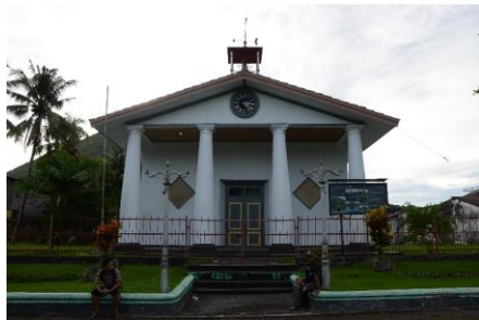
Gambar 1. Hollandische Kerk di Kepulauan Banda, Provinsi Maluku