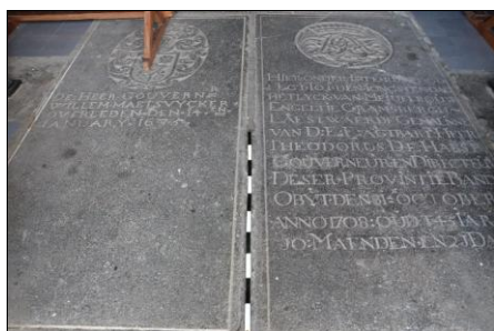
Gambar 2. Detail batu nisan pada lantai bangunan Hollandische Kerk di Kota Neira.

Hollandische Kerk dibangun sekitar tahun 1600-an. Akibat gempa bumi yang dahsyat, gereja ini mengalami kehancuran dan dibangun kembali pada tahun 1852, sebagaimana yang ada sekarang ini. Versi lain menyebutkan, bahwa gereja tua tersebut dibangun pada tanggal 20 April 1873, peresmian penggunaannya pada tanggal 23 Mei 1875 oleh dua orang penginjil yakni Lantzius dan John Hoeke. Selanjutnya gedung ini dibangun di atas 30 kuburan serdadu Belanda yang gugur dalam perang untuk menaklukkan Banda. Pada lantai gereja terlihat ada 30 buah batu nisan dari 30 orang serdadu Belanda, lengkap dengan identitasnya (Tim Penelitian, 2010: 45).