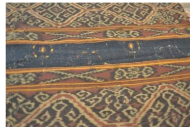
Gambar 5. Motif Gelombang Laut dan Sulur.

pun serta harus tetap utuh tidak terputus. Maksudnya, dengan terjalannya ikatan kekeluargaan diharapkan masyarakat Lampung tidak akan menghadapi kesusahan di mana pun mereka berada. Pemaknaan ini terkait pula dengan kondisi masyarakat Lampung yang cenderung terbuka dalam menerima kedatangan etnis lain (Intani, 2006: 39).