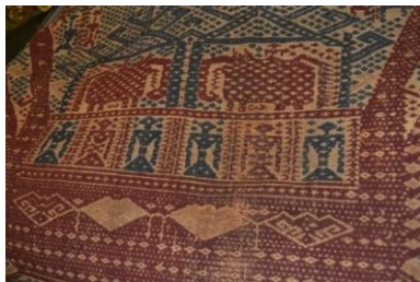
Gambar 6. Inuh Bermotif Kapal dan Manusia

Ragam hias kapal merupakan unsur dominan dalam kain adat Lampung. Bentuk kapal dan warna juga memiliki pemaknaan yang berbeda-beda. Motif kapal dengan warna merah menggambarkan kesakralan dan hubungan dengan dunia atas, kapal berwarna biru menggambarkan hubungan dengan dunia bawah yang profan, selain ada dunia ketiga yaitu dunia tempat manusia dan alam lingkungannya, fauna dan flora sebagai dunia tengah. Warna-warna simbolis beserta muatan atau isi kapal mewakili filosofis unsur makro kosmos dan mikro kosmos secara menyeluruh (Kartiwa, T.th: 7).