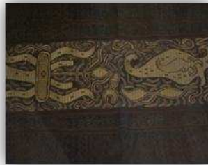
Gambar 3. Inuh Bermotif Hewan Laut.