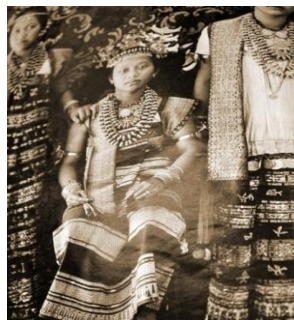
Gambar 6. Wanita Lampung Menggunakan Tapis Inuh

Stratifikasi sosial masyarakat dapat pula dilihat dari bahan pembuat Inuh yang terbuat dari sutera. Bahan sutera tentu tidak bisa didapatkan dengan mudah, hanya kalangan tertentu saja yang mempunyai kemampuan untuk membeli sutera. Artinya, sangat mungkin bahwa para wanita yang membuat atau pun memakai Inuh tentulah bukan rakyat biasa, tetapi kalangan tertentu yang setidaknya serba berkecukupan atau sangat mungkin berasal dari kalangan kerajaan.