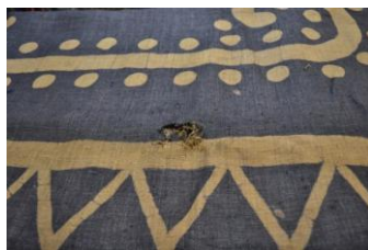
Gambar 4. Inuh Bermotif Gelombang.

Gelombang laut merupakan motif berupa untaian segi tiga yang tersusun vertikal dan horizontal. Untaian segi tiga menggambarkan jenis laut rendah. Sementara untuk gelombang laut besar digambarkan dalam bentuk motif sulur gulung dan pucuk pakis yang berselang-seling (Firmansyah dkk, 1996: 42).