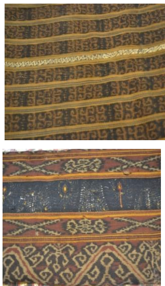
Gambar 2. Kain Inuh yang berumur ± 400 tahun.

Berdasarkan metode celup benang helai per helai, kain Inuh cenderung memiliki warna-warna yang bernuansa gelap. Hal ini terjadi karena warna kain Inuh diambil dari warna-warna yang berasal dari alam. Kondisi ini agak berbeda dengan Tapis-tapis jenis lain yang warnanya cenderung lebih cerah karena menggunakan benang emas dan perak pada motif dan ragam hiasnya.