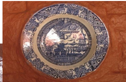
Foto 14. Ornamen Piring pada Dinding Masjid.

arsitektur Romawi, Mesir, Siria, Spanyol, India atau pun dari budaya setempat. Dengan demikian makna yang terkandung di dalam ornamen-ornamen yang terdapat di Masjid Merah mengisyaratkan bahwa Islam tidak melarang hasil daya kreativitas manusia meskipun bukan dihasilkan oleh kaum muslimin, sepanjang tidak bertentangan dengan hukum-hukum Islam.