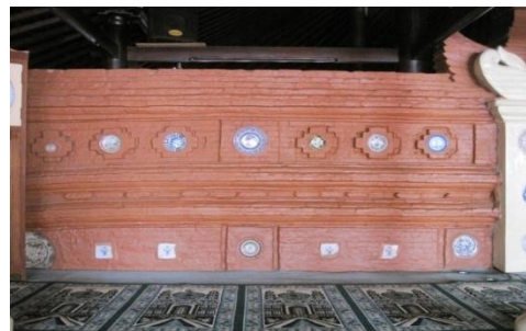
Foto 12. Ornamen pada Dinding Pembatas.

Selain pada pagar tembok atau kuta kosod bagian luar, di bagian dalam terdapat tembok sebagai pembatas antara ruang luar dengan ruangan dalam. Ruangan luar dipakai oleh orang yang shalat setiap hari, sedangkan ruangan dalam hanya dipakai atau dibuka untuk shalat Idul Fitri dan Idul Adha. Pada tembok pembatas terdapat ornamen berupa hiasan piring-piring porselin untuk memperindah suasana dalam masjid tersebut. Piring-piring tersebut merupakan hadiah kaisar Tiongkok kepada Sunan Gunungjati sewaktu beliau menikah dengan putri Ong Tien. Penempatan piring-piring tersebut sebagai ornamen Masjid Merah, menandakan bahwa ajaran Islam tidak menabukan hasil budaya asing.