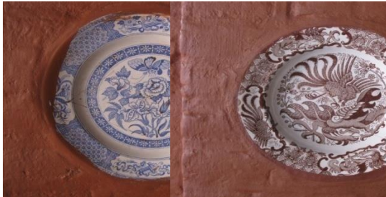
Foto 13. Piring bergambar bunga (kiri) dan piring bergambar flora (kanan).

yang selalu memberikan cahaya dan penerangan divisualisasi dalam bentuk gambar di atas piring. Secara kodrati sinar matahari memberikan warna kehidupan bagi semua makhluk hidup di alam semesta ini, dan secara filosofi sebagai cahaya penerang bagi umat manusia untuk mencari kebenaran yang hakiki. Itulah sebabnya bentuk relief-relief bunga matahari banyak digunakan pada masjid-masjid di Indonesia, seperti Masjid Demak di Demak, Masjid Agung Banten Lama di Banten, Masjid Agung Sang Cipta Rasa di Cirebon.