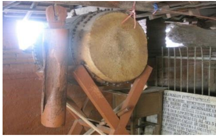
Foto 10. Bedug dan kentongan di Masjid Merah.