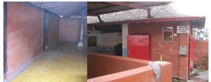
Foto 9. Bekas tempat wudhu (kiri) dan tempat wudhu sekarang (kanan).

Pada awalnya tempat wudhu para jamaah berada sebelah kanan bangunan masjid (Foto 9), kemudian karena ruangan dalam sudah tidak bisa menampung jamaah jika pelaksanaan sholat Idul Fitri dan Idul Adha, selain itu juga bekas tempat wudhu difungsikan sebagai selasar tempat jamaah beristirahat.