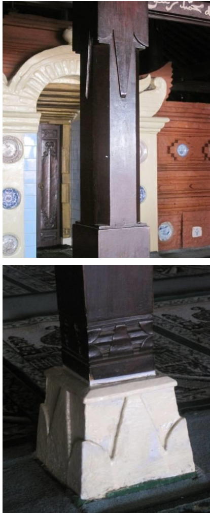
Foto15. Padma pada Tiang Penyangga (atas) dan Padma pada Landasan Tiang (bawah)

Ornamen buah labu yang terbuat dari batu dan bata merah ditempatkan sedemikian rupa sehingga membentuk tipe buah labu. Ornamen ini berfungsi sebagai penyangga pilar/tiang yang terdapat pada ruang utama (dalam) dan ruang luar sebelah barat dan sebelah timur. Ornamen ini dibuat dengan ukuran yang berbeda. Penempatan disesuaikan dengan ukuran saka yang ada. Ornamen yang ada sebagai landasan kayu penyangga dikombinasikan antara bentuk labu dengan bentuk padma . Pada bentuk labu sebagai penyangga banyak dibuat di dalam ruang utama, sedangkan bentuk padma banyak dibuat