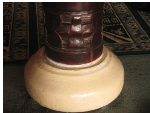
Foto 16. Buah Labu pada Landasan Tiang Penyangga.

pada ruangan tambahan. Seperti pada ruang tambahan kebanyakan dibuat dengan landasan bunga padma . Pada pembuatan ornamen buah labu kayu penyangga/sokoguru berbentuk bulat sedangkan pada landasan kayu penyangga (pilar)-nya berbentuk segi empat. Fungsi dari landasan ini selain dilihat dari segi estetika, juga dilihat dari bentuk keserasian antara bentuk pilar dan bentuk landasan tempat pilar itu berdiri. Maksudnya dari pembuatan ini adalah masyarakat yang masih dikuasai oleh alam cenderung menerima bentuk-bentuk dan bahan secara alami. Kemudian setelah masyarakat mengembangkan teknologi untuk mengatasi alam, cenderung akan mengubah bentuk dan bahan dengan turunannya dan diolah dalam bentuk olahan mereka sendiri. Misalnya bentuk bulatan, bahan kayu, batu, bata tidak harus sempurna, dapat berbentuk segi tiga, bujur sangkar atau pun persegi, begitu juga dengan bahan olahan plester, beton dan kaca. Pembentukan ini akan dikaitkan dengan filosofi nilai-nilai keagamaan.