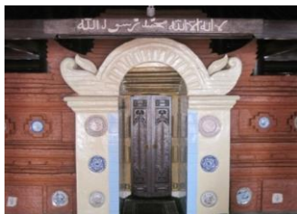
Foto 6. Mihrab bagian luar Masjid Merah.

Dari waktu ke waktu, mihrab mengalami perkembangan wujud tanpa mengalami perkembangan fungsi. Mihrab yang awalnya merupakan bentuk dekoratif pada dinding kiblat, berkembang menjadi ruang pengimaman yang dikenal sebagai Maqsura . Pada Masjid Merah Panjunan tempat pengimaman ada 2 buah, pertama tempat pengimaman yang hanya dipakai 2 kali dalam setahun, yakni pada saat hari raya Idul Fitri dan hari raya Idul Adha yang berada di bagian dalam. Adapun yang satu lagi, yang semula sebagai pintu masuk ke ruang utama dipakai untuk tempat pengimaman pada shalat berjamaah masyarakat umum. Kekukuhan dan keteraturan yang mendominasi citra luar arsitektur masjid, dipadukan dengan kelapangan dan keindahan suasana ruang dalamnya mencerminkan sikap lahir dan batin yang harus dimiliki oleh umat Islam. Kemudian upaya pencapaian fisik itu dikunci dengan mengarahkan orientasi bangunan ke satu titik: Kiblat utama, yaitu Ka'bah Baitullah. Seluruh susunan itu menuju satu pesan: satu titik keesaan Allah. Arsitektur masjid seakan memberi contoh, betapa upaya sepenuh daya tersebut seakan berakhir tunduk dan berserah diri kepada sang Khaliq. Di balik perintah untuk menghadap wajah ke Kiblat yang satu, Ka'bah, memiliki kedalaman makna. Ka'bah Baitullah diyakini dipilih oleh Allah sebagai awal tempat ibadah di bumi.