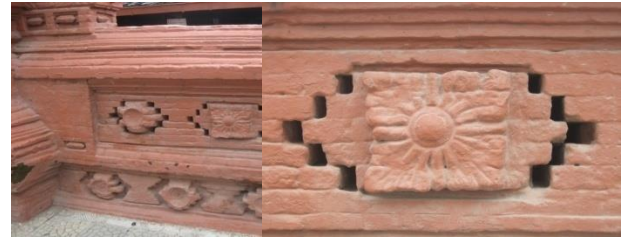
Foto 11. Bentuk ornamen dinding (kiri) dan relief bunga matahari (kanan).

Simbol yang terdapat dalam relief tersebut mempunyai makna bahwa matahari menggambarkan sinar penerangan atau pun pencerahan bagi seluruh umat manusia untuk menggapai keimanan dan ketakwaan kepada Allah SWT. Jika disimak makna ini, maka dapat dikatakan bahwa dari tempat inilah kita belajar, memahami, mengimani, kemudian mengamalkan semua ajaran Islam.