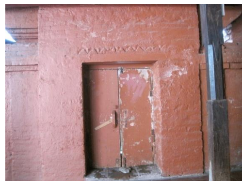
Foto 2. Pintu masuk sebelah selatan.

hanya 1,5 m. Jadi jika jamaah akan masuk masjid harus menundukkan kepala. Makna yang terkandung dalam pembuatan pintu ini adalah agar manusia bersifat tawadhu, merendahkan diri di hadapan Allah SWT. Dengan menundukkan kepala dalam memasuki masjid ini, para wali secara tidak langsung mengajarkan kepada kita selaku umat sesudahnya, agar menghormati tempat tersebut sebagai tempat suci. Sebagai tempat berserah diri, berdoa, dan mendekatkan diri kepada-Nya.