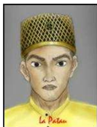
Gambar 5. La Patau, raja Bone ke-16.

Sebelum diangkat menjadi raja Bone, ia menjabat jabatan sebagai Panglima Perang Kerajaan Bone.