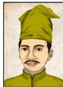
Gambar 2. Sultan Abdul Jalil, raja Gowa ke-19.