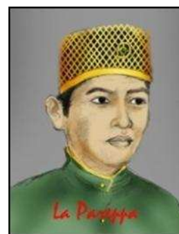
Gambar 6. La Pareppa To Sappewali Raja Gowa ke-21 dan raja Bone ke18.