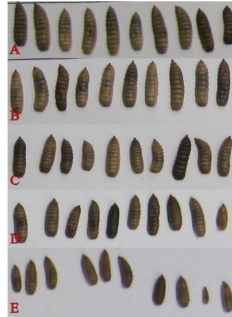
Gambar 2. Perbedaan morfologi maggot pada setiap perlakuan

Berdasarkan hasil sampel panjang dan berat individu maggot pada perlakuan A menunjukkan berat rata-rata maggot 0.147 g dengan panjang rata-rata 1.75 cm dan pada perlakuan B berat rata-rata maggot 0.159 g dengan panjang rata-rata 1.72 cm. Perlakuan C menunjukkan berat rata-rata maggot 0.136 g dengan panjang rata-rata 1.66 cm sedangkan berat rata-rata maggot pada perlakuan D 0.109 g dengan panjang rata-rata 1.51 cm. Perlakuan E berat rata-rata maggot 0.049 g dengan panjang rata-rata 1.19 cm. Perbedaan morfologi maggot pada setiap perlakuan dapat dilihat pada Gambar 2.