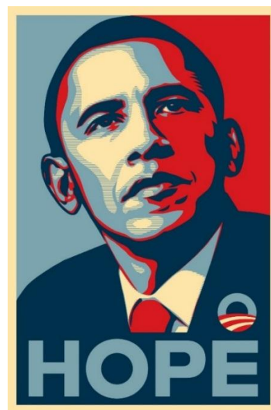
Gambar 1. Salah satu seri Poster kampanye Barack Obama yang paling dikenal baik

Obama berjudul "Hope" yang digunakan oleh Obama pada saat kampanye kepresidenan Amerika Serikat di tahun 2008 lalu. Poster tersebut menjadi ikonik dari kampanye Obama yang didesain Fairey dalam waktu satu hari. Bentuk tampilan khas dari poster bergaya stencil dengan menampilkan wajah Obama dalam nuansa campuran warna merah, biru pastel, biru tua dan putih gading yang dibawahnya tertulis kata-kata 'Hope' tersebut dapat diterima dengan sangat baik oleh masyarakat Amerika Serikat di masa kampanye itu. Hal itu terbukti dengan habisnya keseluruhan poster sebanyak 350 lembar yang dicetak Fairey hanya dalam waktu satu hari. Setelah kemenangan Barack Obama diumumkan, tepatnya pada bulan Januari tahun 2009, poster tersebut kemudian dibeli oleh Smithsonian Institute untuk dipajang dalam galeri National Portrait yang mereka miliki.