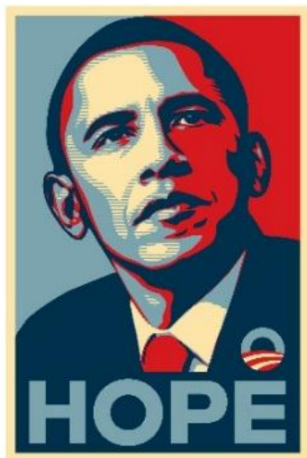
Gambar 5. Perbandingan Ukuran Poster "HOPE" Obama

Terdapat ruang sisa di beberapa area poster, posisi area kosong pada layout poster ini dapat memberikan area yang menegaskan