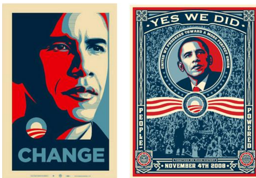
Gambar 2. Poster kampanye Barack Obama versi "Change" dan "Move On"

Bila ditelusuri keseluruhan seri poster Obama, ada beberapa poster yang juga dibuat oleh Fairey Shepard dan masih berkaitan dengan poster 'HOPE' Obama. Dapat terlihat bahwa elemen yang konsisten terdapat pada semua seri poster ini adalah warna merah dan biru, dan ada juga beberapa elemen yang masih berkaitan dengan poster 'HOPE'. Pemakaian warna yang konsisten pada setiap poster ini menciptakan suatu citra pada Obama.