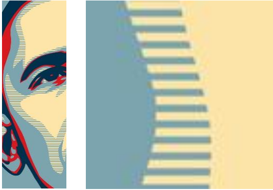
Gambar 9. Penggunaan warna pada Poster “HOPE”

yaitu perubahan warna dari biru muda menuju kuning. Bila diperbesar, dapat terlihat bahwa efek gradasi ini terjadi oleh garis-garis repetisi antara warna biru dan kuning.