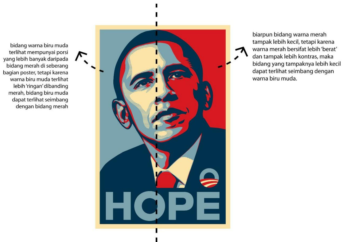
Gambar 8. Keseimbangan penggunaan warna pada Poster “HOPE”

warna dan penempatan komposisi wajah Obama. Dapat terlihat bidang biru muda di sebelah kiri menempati porsi yang lebih banyak daripada area warna merah di sebelah kanan. Tetapi pemakaian area biru muda yang lebih banyak oleh warna biru muda, tidak membuat ke-seimbangan poster menjadi berat sebelah, dikarenakan oleh sifat warna biru muda yang cenderung bersifat lebih ‘ringan’ diban-dingkan dengan warna merah yang cenderung bersifat lebih ‘berat’.