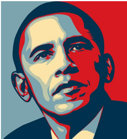
Gambar 14. Ilustrasi wajah Obama pada Poster “HOPE”

Pada pembahasan sebelumnya, sudah dijelaskan beberapa struktur poster, hal-hal yang menjadi elemen pembentuk sebuah poster. Pemakaian potret wajah Obama sebagai objek utama poster memiliki alasan khusus. Wajah menjadi bagian pada tubuh manusia yang paling banyak mempunyai perbedaan dengan wajah individu manusia lainnya, wajah pun yang menjadi pembeda antara manusia yang satu dengan yang lain. Oleh karena itu, Fairey memakai figur wajah sebagai objek mengolah karyanya. Foto yang dipakaipun memakai foto candid pada