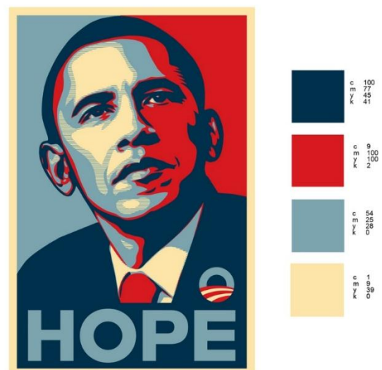
Gambar 12. Penggunaan warna pada Poster "HOPE"

Warna menjadi salah satu elemen yang penting pada poster 'HOPE' Obama, tidak