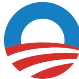
Gambar 17. Logo Poster Kampanye Barack Obama

Secara historis, logo kampanye politik selalu dibuat sederhana, menyertakan nama kandidat dan beberapa ornamen warna. Logo kampanye Obama membuat beberapa terobosan dari sebuah logo kampanye politik konvensional, beberapa orang berpendapat ini merupakan logo politik paling inovatif sampai saat ini dan logo ini memiliki makna yang sangat berkaitan dengan visual pada poster HOPE Obama. Bobby Calder, seorang Profesor Kellogg School of Management mempunyai pendapat mengenai logo Obama,