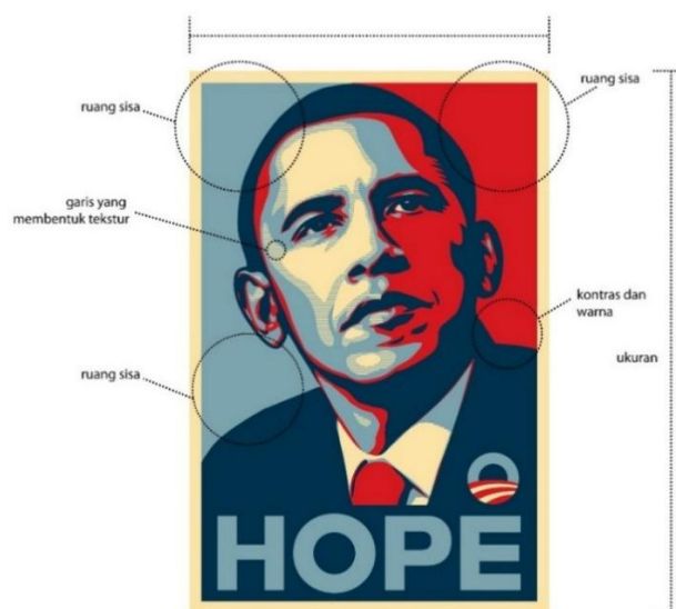
Gambar 1. Struktur Poster "HOPE" Obama

Sebuah karya seni umumnya dibangun oleh prinsip dan elemen desain yang menjadi struktur pembentuk karya seni tersebut, inilah yang menjadi anatomi dasar sebuah karya seni.