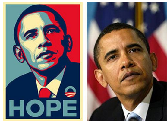
Gambar 15. Perbandingan ilustrasi dan foto asli

Dalam definisi fotografi, foto candid bisa berarti foto atau potret yang dibuat dengan cara sembunyi-sembunyi sehingga objek foto tidak menyadarinya. Cara ini biasanya menghasilkan foto yang terkesan wajar dan alami. Umumnya tidak ada komunikasi antara pemotret dan objek foto. Keberhasilan foto sangat ditentukan oleh kemahiran pemotret mengungkapkan pesannya.