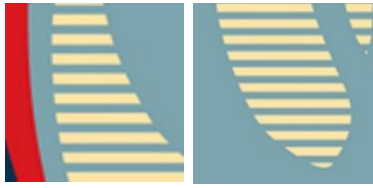
Gambar 3. Garis dan Tekstur pada Poster "HOPE" Obama

Terdapat garis-garis berulang bila diteliti pada bagian muka Obama yang membentuk efek gradasi. Efek garis berulang antara warna biru muda dan kuning yang bertumpuk ini juga membentuk efek tiga dimensi yang menegaskan karakter karya stencil. Bila melihat dari sisi tekstur visual, dapat ditegaskan bahwa garis-garis berulang yang terdapat pada ilustrasi wajah, dapat dikategorikan sebuah tekstur visual.