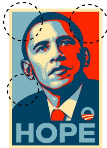
Gambar 4. Ruang sisa pada Poster "HOPE" Obama

objek utama dari poster, yaitu potret wajah Obama itu sendiri.