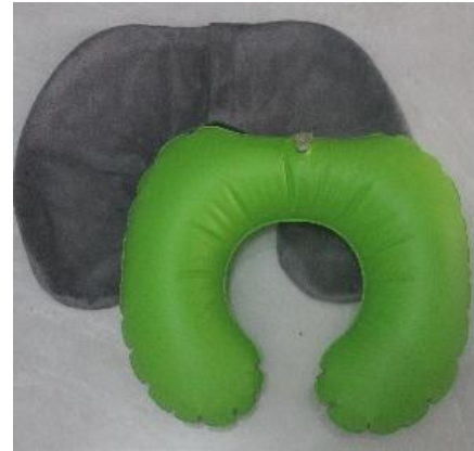
Gambar 14. Bantal Leher Tiup

Untuk dapat menggunakan bantal ini, pengguna harus mengisi bantal dengan dengan cara ditiup agar bantal mengembang. Kelebihan dari bantal ini adalah tekanan dapat disesuaikan sesuai keinginan pengguna. Ketika pengguna berada dalam pesawat yang sedang mengudara, tekanan udara pada bantal akan mengalami perubahan. Menurut hasil wawancara, tekanan dalam bantal akan berubah semakin keras sehingga cengkaman pada leherpun semakin keras.