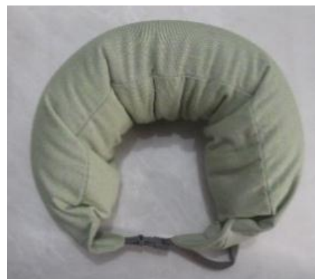
Gambar 15. Bantal Leher U-Shaped

Bentuk bantal ini panjang seperti guling jika kedua ujung bantal tidak dikancingkan. Bantal ini lebih fleksibel jika dibantingkan dengan bantal leher yang berbentuk U. Bentuk bantal juga dapat diatur sesuai keinginan.