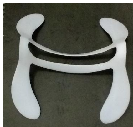
Gambar 18. Ribs dalam Bantal Leher TRTL