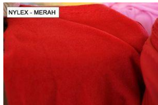
Gambar 4. Kain Nylex