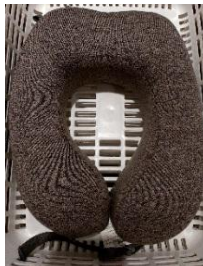
Gambar 10. Bantal U