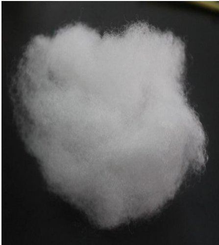
Gambar 5. Dakron

Selain digunakan untuk bahan pengisi bantal dakron juga digunakan sebagai bahan untuk pengisi boneka, guling, bed cover, furniture, dan produk lainnya. Saat ini dipasaran ada beberapa jenis dakron yang beredar dengan kualitas yang berbeda-beda. Aneka jenis dakron tersebut adalah Siliconized Polyester Fiber, Silicon, dan Dakron Reguler.