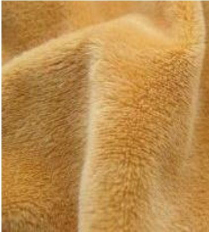
Gambar 2. Kain Velboa

satu bahan kain berkualitas untuk bahan luar pembuatan boneka dan bantal. Variasi warnanya juga lebih beragam dan sangat lengkap. Mulai dari warna kuning, hijau, pink, merah, ungu, biru, serta bermacam-macam warna cerah lainnya.