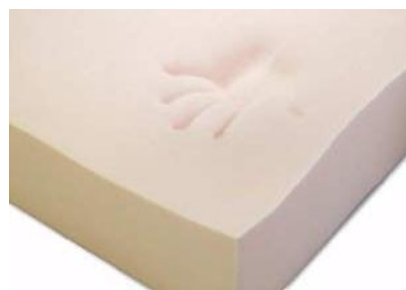
Gambar 7. Memory foam saat setelah menerima tekanan