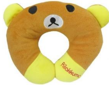
Gambar 12. Bantal leher karakter kartun (Sumber www.tokopedia.com , diakses pada mei 2018)

anak-anak, karakter yang menampilkan logo dari klub olahraga untuk para supporter dari masing-masing klub, dan sebagai media promosi sebuah perusahaan.