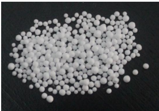
Gambar 8. Manik-manik

tidak mudah panas. Bahan manik-manik ini menjadi populer dan karena bentuk dan tekstur yang unik. Namun, bahan ini memiliki kekurangan yaitu tidak dapat dicuci dengan air lalu dijemur dibawah sinar matahari seperti bantal yang terbuat dari bahan yang lain. Perawatan bantal dengan isi manik-manik adalah dengan menyimpannya di suhu ruangan yang tidak terlalu panas atau dingin. Manik-manik dapat bertahan 1-5 tahun tergantung kualitas manik-manik itu sendiri.