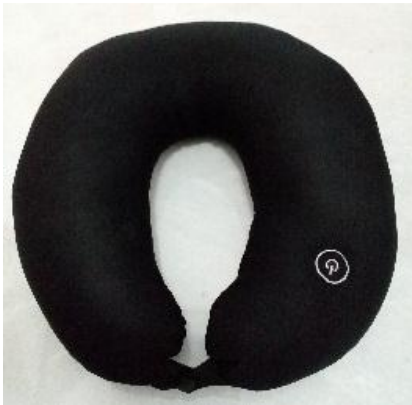
Gambar 19. Bantal Leher Pijat

leher huruf U pada umumnya, hanya saja terdapat penambahan sistem pemijat pada bagian dalam bantal. Beban bantal ini lebih berat dari bantal leher biasa, dan keterbatasan ruang gerak pengguna karena adanya sistem pemijat dibagian dalamnya.