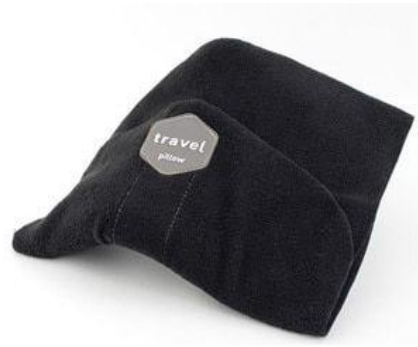
Gambar 17. Bantal Leher TRTL

untuk menopang bagian kepala dan leher pada bahu. Bantal ini sangat fleksibel dan simpel, tidak membutuhkan banyak ruang penyimpanan. Namun, kurang nyaman saat digunakan karena hanya akan menopang salah satu bagian yang terdapat ribs. Sedangkan bagian kepala lainnya yang tidak terdapat ribs tidak ada sandarannya.