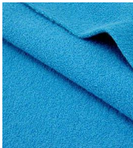
Gambar 1. Kain fleece