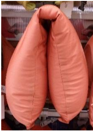
Gambar 16. Bantal Leher U-Shaped