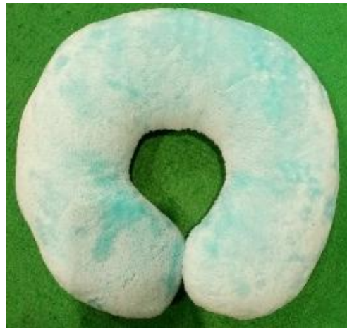
Gambar 9. Bantal U

Penggunaan bantal leher berbentuk U ini adalah yang paling umum. Namun, bantal ini hanya menyediakan fasilitas sebagai penopang leher saja tanpa ada fungsi tambahan lainnya. Berbeda halnya jika ditambahkan aksesoris pada setiap ujung untuk mengikat sisi satu sama lainnya, agar bantal tidak terlepas saat digunakan. Aksesoris bisa berupa kancing atau pengikat dengan kuncian.