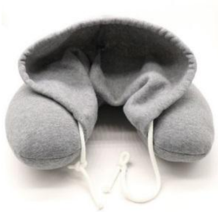
Gambar 13. Bantal leher hoodie