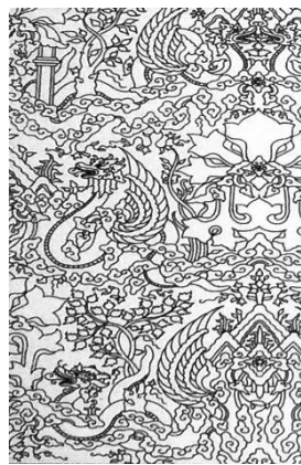
Gambar 6. Sketsa Motif Naga Seba

Elemen wimba dalam motif Naga Seba di atas, terdiri atas obyek naga, gerbang, pohon, wadsan, dan awan.