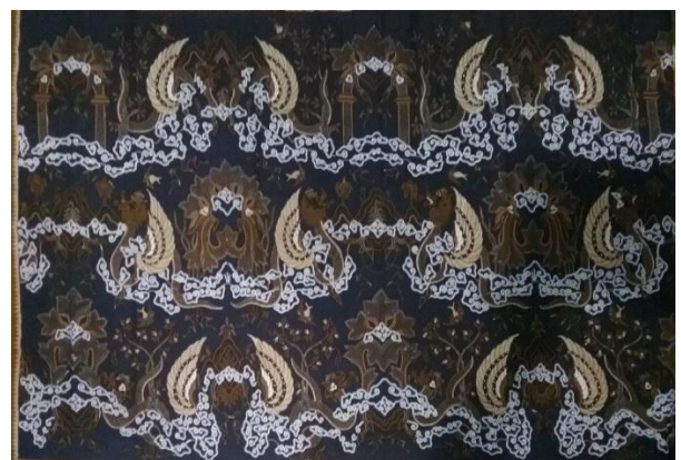
Gambar 4. Contoh motif Naga Seba dengan komposisi warna latar biru pada (Batik Katura, 2018)

Dalam penelitian ini, diambil motif Naga Seba versi Keraton Kasepuhan Cirebon.