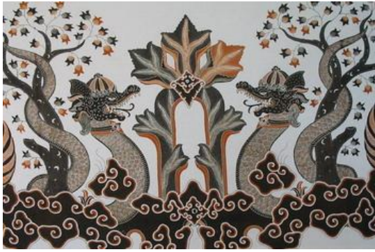
Gambar 1. Motif Naga Seba tanpa sayap (Bernath, 2012)