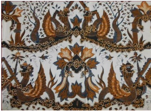
Gambar 2. Motif Naga Seba bersayap (Kepulauan Batik, 2016)