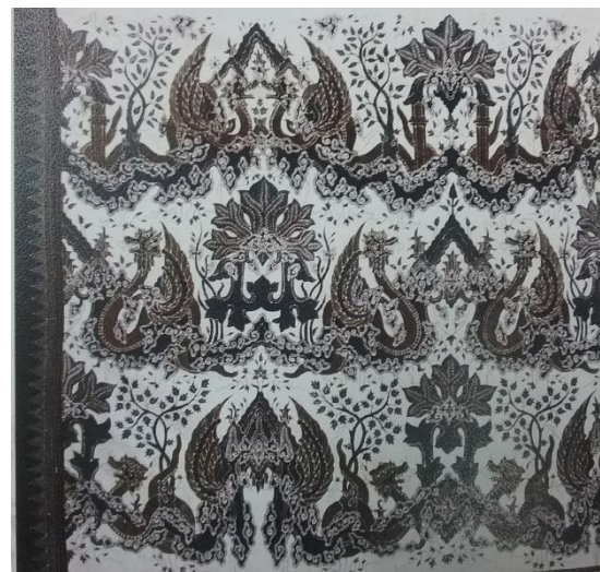
Gambar 7. Detail Motif Naga Seba

secara horizontal pada setiap baris, Namun, jika dibandingkan, terlihat bentuk penggambaran yang berbeda pada baris bawah, tengah, dan atas.