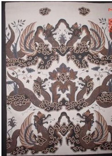
Gambar 3. Penggambaran dua jenis naga dalam satu kain (Bernath, 2012)

Selain keberadaan naga yang saling berhadapan, ciri visual lain kain batik bermotif Naga Seba adalah: