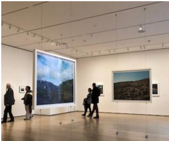
gambar 3. Aktivitas Pengunjung dalam Galeri

Gambar di atas memperlihatkan interior ruang pameran lukisan yang dipajang dengan teknik display menggantung dari plafon. Dengan wire yang memiliki ketebalan 3mm, dikaitkan pada plafond dan frame lukisan, bagian bawah diberi pemberat seperti yang terlihat pada gambar di atas. Dengan tata letak susunan lukisan seperti gambar di atas, pengunjung tidak menemukan kesulitan dan arah pada saat menikmati karya lukisan. Kesan bersih dan lapang membuat pengunjung nyaman dan bebas bereksplorasi di dalam ruang pameran ini.