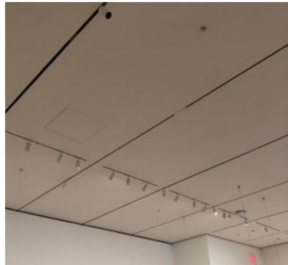
Gambar 15. Sistem Pencahayaan Ruang Pameran

Gambar diatas adalah ruang pameran di lantai 2, terlihat semua didesain dengan sangat simple dan modern. Ruang menurut konsep teknis terbagi dua yakni ruang luar dan dalam, yang masing masing memiliki penanganan khusus. Area pajang diatas memiliki konsidi visual yang bersih dan tertata. Dinding plafon serta tinggi display semua telah disesuaikan dengan ergonomic dan fleksibilitas pada pameran seni