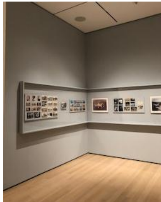
gambar 2. Sudut Ruang Pamer

seperti untuk pengamat, karya seni maupun pendukung dan aksesories. Ruangan ditata sedemikian yang memiliki sirkulasi cukup baik tanpa mengganggu pengunjung yang ingin menikmati karya seni di dinding maupun installation pada ruang tengah.