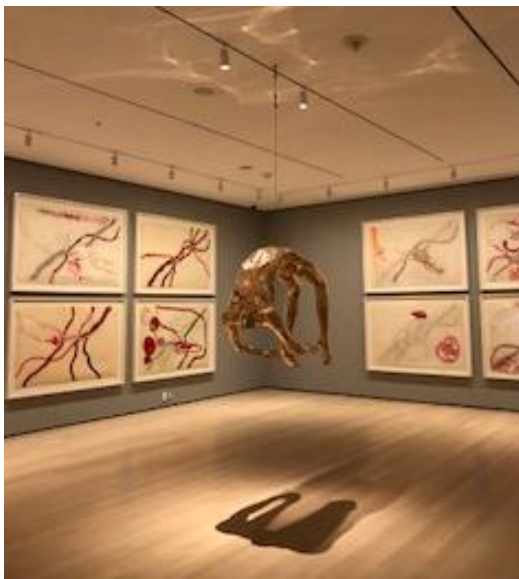
gambar 1. Area Pamer

The Museum of Modern Art masuk dalam kategori museum kontemporer yang bersifat campuran dimana terdapat koleksi yang permanen maupun yang mengikuti trend kekinian pada saat ini. Terdapat pula karya yang memang dapat dibeli oleh pengunjung serta terdapat pula master piece yang hanya dapat dinikmati pengunjung dan dijaga ketat oleh bagian keamanan.