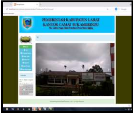
Gambar 9. Halaman Utama

pengelolaan data penduduk pada kantor camat sukamerindu. Dimana tampilan yang muncul pertama kali adalah halaman utama sistem pengelolaan data penduduk kantor camat sukamerindu. dapat dilihat pada gambar berikut ini.