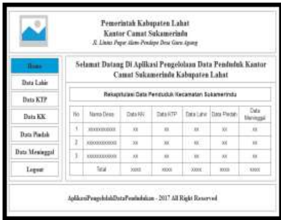
Gambar 5. Desain Form Halaman Camat

Tampilan halaman camat berisi pilihan menu-menu yang dapat diakses oleh camat untuk melihat laporan data penduduk yang telah dibuat oleh admin , seperti pada gambar dibawah ini :