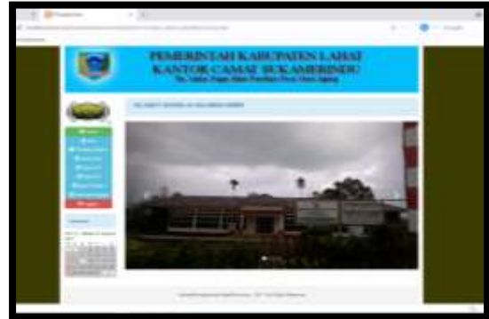
Gambar 11. Halaman Admin

Halaman ini menampilkan menu-menu pilihan yang dapat diakses oleh admin, dimana admin dapat melakukan proses menambah, mengubah dan menghapus data. Berikut menu yang terdapat di halaman admin .