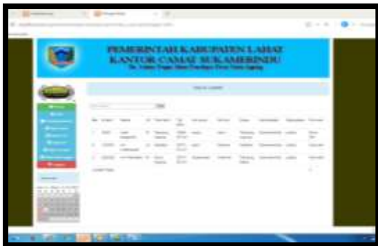
Gambar 18. Output Data Lahir

Halaman ini menampilkan hasil dari input yang dilakukan oleh admin . Sehingga menghasilkan output yang akan menjadi informasi untuk user . Berikut gambar yang di tampilkan.