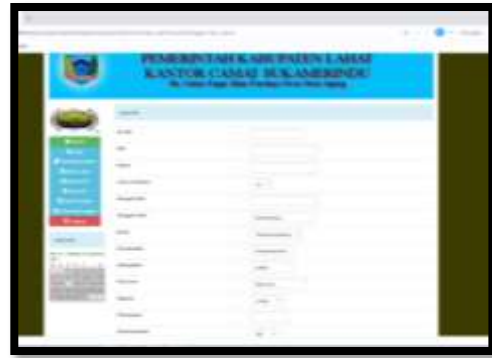
Gambar 15. Form Input Data KK

Halaman ini menampilkan formulir yang bisa diisi untuk menambah data berdasarkan data KK (Kartu Keluarga) yang dimiliki penduduk, namun pengisian formulir tersebut hanya bisa dilakukan oleh admin .