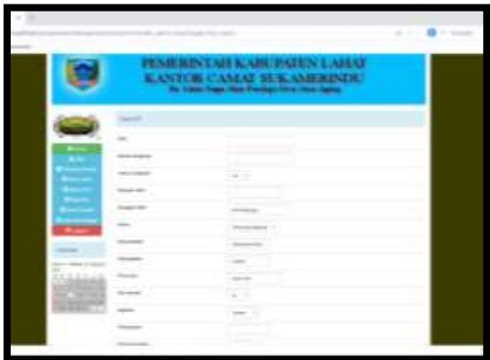
Gambar 14. Form Input Data KTP

Halaman ini menampilkan formulir yang bisa diisi untuk menambah data berdasarkan data KTP (Kartu Tanda Penduduk) yang telah dimiliki penduduk, namun pengisian formulir tersebut hanya bisa dilakukan oleh admin .