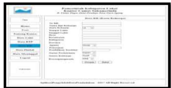
Gambar 8. Desain Form Input Data KK

Tampilan ini berisi tampilan untuk penambahan data penduduk berdasarkan data Kartu Keluarga (KK), seperti pada gambar dibawah ini: