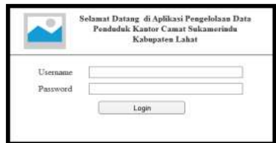
Gambar .3 Desain Form input Login

Tampilan menu login berupa nama dan password untuk masuk ke dalam sistem atau untuk membuka program pertama kali, seperti pada gambar dibawah ini :