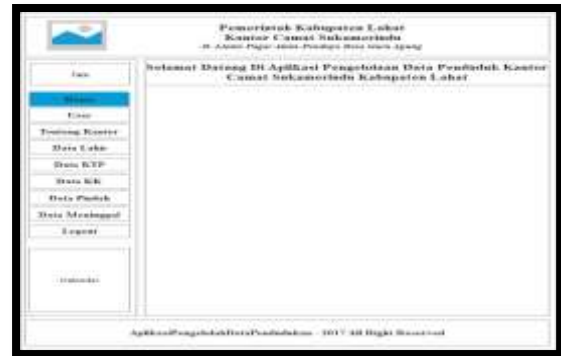
Gambar 2. Desain Form Halaman Utama

Tampilan halaman utama berisi pilihan menu-menu yang dapat diakses oleh user untuk melihat informasi data penduduk yang telah dimasukan admin , seperti pada gambar dibawah ini :