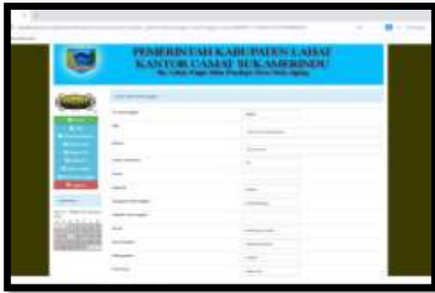
Gambar 17. Form Input Data Meninggal