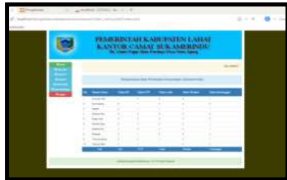
Gambar 12. Halaman Camat

Halaman ini menampilkan menu-menu pilihan yang dapat diakses oleh camat sebagai laporan dari admin . Dimana memiliki menu-menu seperti gambar dibawah ini.