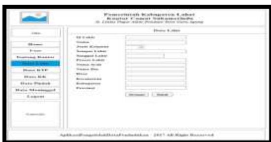
Gambar 6. Desain Form Input Data Lahir

Tampilan ini berisi tampilan untuk penambahan data penduduk berdasarkan data kelahiran penduduk, seperti pada gambar dibawah ini :