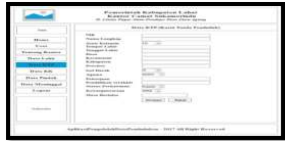
Gambar 7. Desain Form Input Data KTP

Tampilan ini berisi tampilan untuk penambahan data penduduk berdasarkan data Kartu Tanda Penduduk, seperti pada gambar dibawah ini :