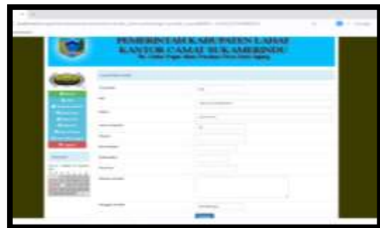
Gambar 16. Form Input Data Pindah

Halaman ini menampilkan formulir yang bisa diisi untuk menambah data berdasarkan penduduk yang pindah desa, namun pengisian formulir tersebut hanya bisa dilakukan oleh admin .