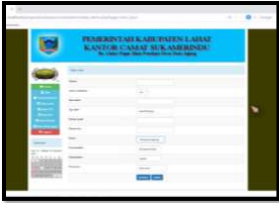
Gambar 13. Form Input Data Lahir