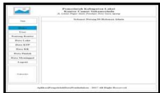
Gambar 4. Desain Form Halaman Admin

Tampilan halaman admin berisi pilihan menu-menu yang dapat diakses oleh admin untuk menambah, mengubah dan menghapus data yang di dalam sistem, seperti pada gambar dibawah ini :