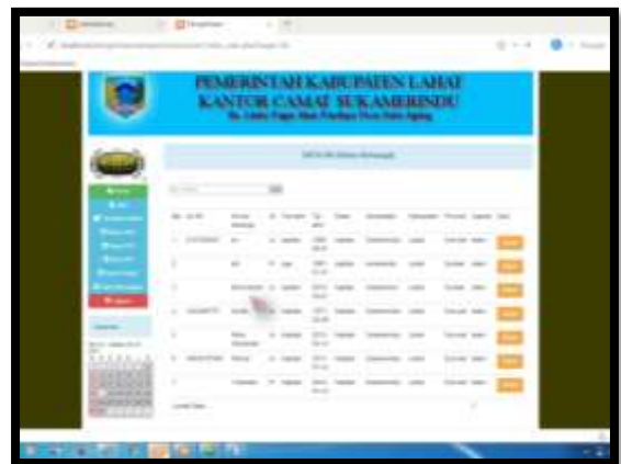
Gambar 20. Output Data KK

Halaman ini menampilkan hasil dari input yang dilakukan oleh admin . Sehingga menghasilkan output yang akan menjadi informasi untuk user . Berikut gambar yang di tampilkan.