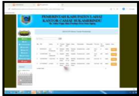
Gambar 19. Output Data KTP

Halaman ini menampilkan hasil dari input yang dilakukan oleh admin . Sehingga menghasilkan output yang akan menjadi informasi untuk user . Berikut gambar yang di tampilkan.