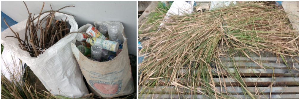
Gambar 3. Material Sampah