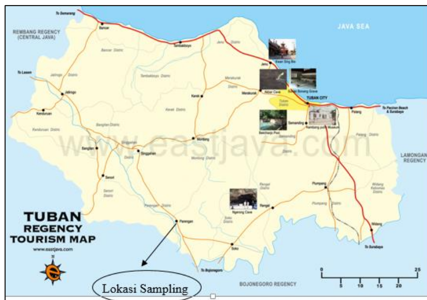
Gambar 1. Peta Lokasi Sampling

Untuk penentuan bau dan rasa menggunakan metode pengamatan organoleptik, sedangkan untuk nilai TDS digunakan metode Gravimetri dengan menggunakan timbangan analitik. Nilai pH ditentukan dengan pH meter, nilai warna menggunakan alat Kalorimeter, sulfat dan kesadahan menggunakan alat Spektrofotometer UV-vis dan untuk penentuan kandungan logam digunakan alat Flame-Atomic Absorption Spectroscopy (AAS) , merk Shimadzu type 6800AA.