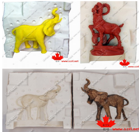
Gambar 2. Cetakan karet produk mainan anak