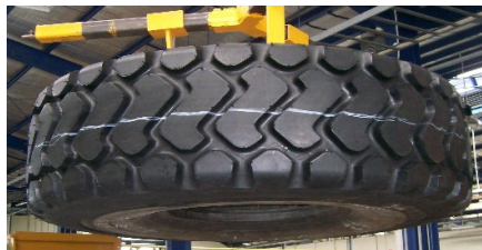
Gambar 6. Tampak depan produk akhir vulkanisir ban alat

Umur cetakan diukur dari berapa kali suatu cetakan bisa digunakan dalam produksi. Umur tersebut akan menjadi nilai pembagi biaya produksi cetakan yang akan diperhitungkan dalam harga produk. Sejak pertama kali dibuat pada bulan November 2008, mould yang pertama kali diproduksi hingga akhir Mei 2009 sudah dipakai produksi sejumlah 18 kali. Kondisi cetakan tersebut masih bagus dan masih layak untuk digunakan.