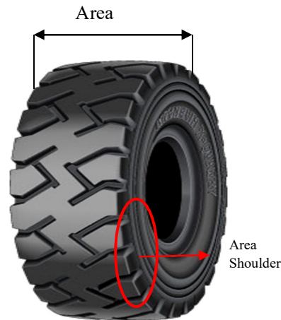
Gambar 4. Area crown dan shoulder

Kesulitan yang akan dihadapi dengan cetakan hingga bagian shoulder adalah pada saat proses loading/unloading produk di mesin envelope spreader , karena cetakan harus ditarik / dibuka agar ban bisa masuk. Sifat tahan sobek & elastisitas cetakan sangat penting dalam proses ini karena jika tidak mould akan sobek saat di tarik.