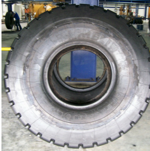
Gambar 5. Tampak samping produk akhir vulkanisir ban alat berat

Dalam percobaan yang kedua dan diteruskan hingga saat ini bentuk produk yang dihasilkan bagus sekali, terutama dari pattern & OTD (original tread depth) yang dibentuk sama persis dengan ban baru.