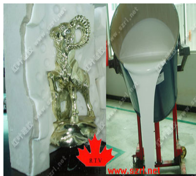
Gambar 3. Cetakan karet produk patung

Banyaknya produk yang menggunakan cetakan karet ini karena melihat keunggulan yang dimiliki bila menggunakannya. Keunggulan cetakan berbahan dasar karet ini adalah