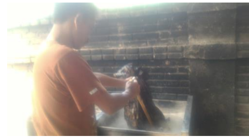
Gambar 4. Penerapan Produk Bak Celup pada Mitra Pertama