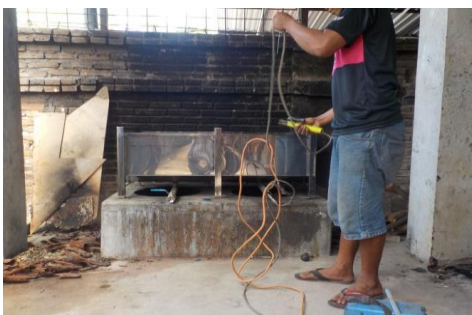
Gambar 3. Pembuatan Bak Celup untuk Lorotan dan Pewarnaan