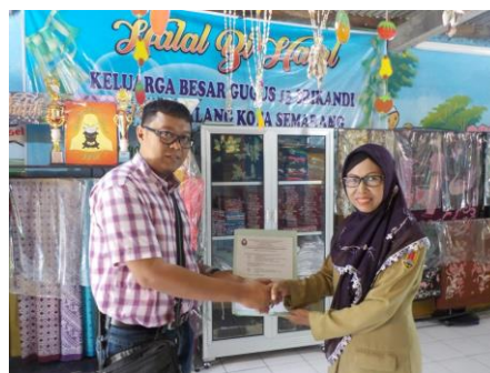
Gambar 6. Serah Terima Produk Bak Celup