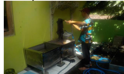
Gambar 5. Penerapan Produk Bak Celup pada Mitra Kedua