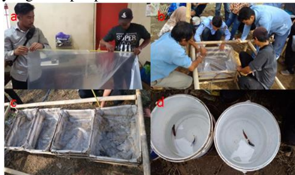
Gambar 3. Sesi Kedua

Sesi kedua berupa praktek pemanfaatan lahan yang ada (milik warga) dengan cara membuat kolam terpal seperti yang terdapat pada Gambar 3.