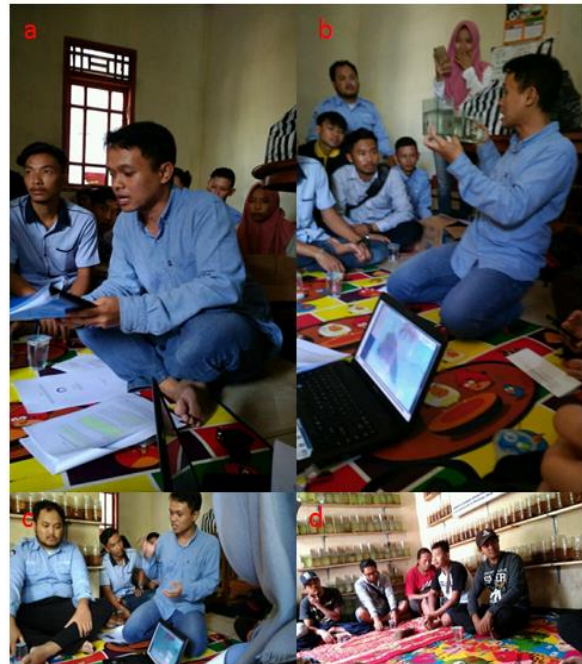
Gambar 2. Sesi Pertama

dengan melakukan kegiatan budidaya ikan cupang seperti yang terdapat pada Gambar 2.