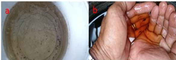
Gambar 4. Hasil Anakan Ikan Cupang

Setelah kegiatan sesi kedua selesai, yaitu proses pemijahan, hasil dari pemijahan 3 pasang indukan ikan cupang, keseluruhannya berhasil menghasilkan anakan dalam waktu sekitar 3 hari, seperti yang terdapat pada Gambar 4 mengenai hasil anakan ikan cupang.