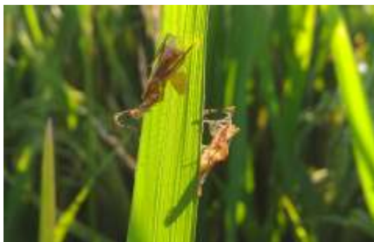
Gambar 12. Walang Sangat Terdampak BVR

Selain kesalahan dalam pengaturan jarak tanam, tanaman padi juga terserang berbagai macam hama seperti misalnya : hama keong, sundep, ulat grayak, jamur blast, jamur xanthomonas, jamur putih palsu dan belalang (walang) sangat. Sebenarnya langkah antisipasi sudah dilakukan, yaitu dengan cara penyemprotan agen hayati berupa jamur Beauveria bassiana (BVR) untuk pencegahan berbagai macam serangga dan jamur Trichoderma untuk pencegahan hama jamur. Hanya saja, penggunaan agen hayati ini belum mampu membasmi serangan hama, karena cara kerja agen hayati dalam membunuh hama berlangsung secara pelan. Gambar 13 berikut ini membuktikan cara kerja jamur Beauveria bassiana dalam membunuh serangga belalang sangat. Untuk perbaikan pola tanam kedepan, perlu ada mekanisme pembasmian hama memanfaatkan pestisida nabati.