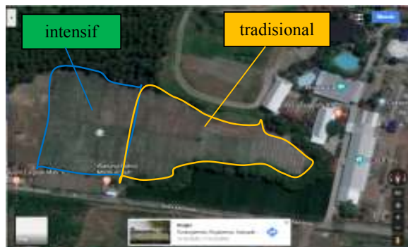
Gambar 2. Lokasi Lahan Untuk Tanam Padi

Adapun lahan yang dijadikan lokasi uji coba penanaman berada di desa Badean, kecamatan Blimbingsari, Kabupaten Banyuwangi. Koordinat lokasi lahan, berada pada koordinat Latitude : -8.303845, Longitude : 114.328882. Total luas lahan adalah 3 hektar, dimana dalam kegiatan uji coba ini, lahan dibagi menjadi dua bagian, masing-masing seluas 1,5 hektar, dengan perlakuan tehnik penanaman dan pemupukan yang berbeda. Lahan pertama seluas 1,5 hektar dikelola dengan standar penanaman yang ditetapkan mitra konsultan yaitu PT.AHS. Untuk selanjutnya lahan dengan standar dari PT.AHS disebut pola tanam intensif. Sedangkan lahan kedua dengan luas 1,5 hektar, dikelola sesuai dengan adat kebiasaan masyarakat di desa Badean, kecamatan Blimbingsari Banyuwangi. Untuk selanjutnya, lahan kedua ini dinamakan pola tanam tradisional. Gambar 2 berikut ini menunjukkan peta lokasi uji tanam padi tersebut.