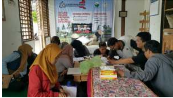
Gambar 5. Tahapan Diverge (Kembangkan)

Tahapan yang ketiga adalah tahap decide (memutuskan). Tujuan utama tahap ini adalah memutuskan mana masalah utama yang dihadapi petani dan mana solusi utama yang dirumuskan oleh tim. Untuk selanjutnya, hasil keputusan permasalahan dan solusi utama inilah yang akan dieksekusi menjadi prototype produk startup. Gambar 6 ini menunjukkan proses memutuskan masalah terbanyak dan solusi utamanya.