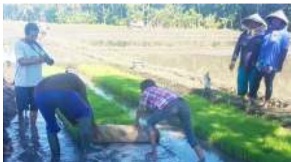
Gambar 8. Pemindahan Bibit ke Lokasi Tanam

dengan penanaman yang dilakukan mulai tanggal 17 Februari 2019 sampai dengan 19 Februari 2019. Gambar 8 berikut ini membuktikan kegiatan proses penanaman padi, dengan metode jajar legowo 2:1.