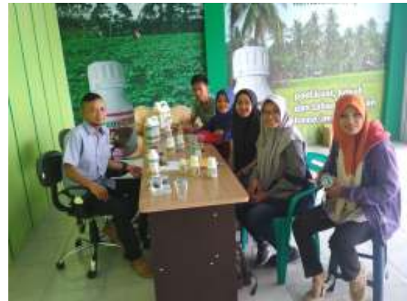
Gambar 4. Tahapan Understanding Koordinasi dengan Mitra

Pada tahap understanding (memahami) ini tujuan utamanya adalah tim STIKOM PGRI Banyuwangi mampu menggali masalah yang dihadapi petani, mulai dari permasalahan permodalan, kondisi tanah sebelum ditanami, pembibitan yang efisien, pemupukan yang terukur dengan dosis tertentu sampai dengan penanganan serangan hama. Gambar 3 berikut ini menunjukkan proses pemahaman bagaimana bertani yang baik dan benar, dimana tim dari STIKOM PGRI Banyuwangi, sedang diberi arahan oleh staff ahli PT. AHS, banyuwangi.