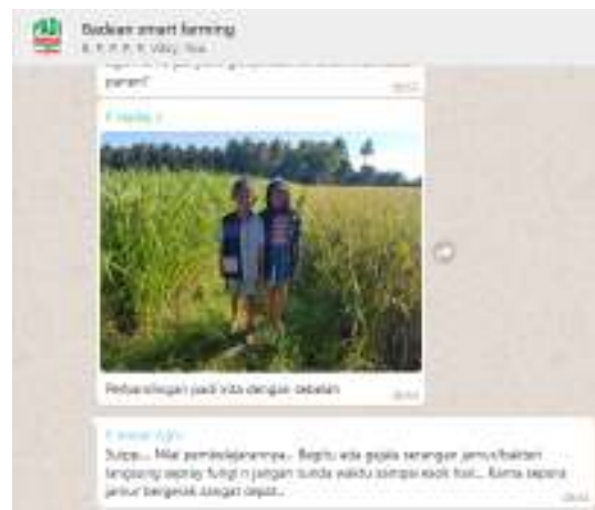
Gambar 7. Koordinasi dengan Group Whatsapp

Adapun untuk berkomunikasi dan koordinasi dalam kegiatan pengabdian kepada masyarakat ini penulis dan seluruh tim mitra menggunakan group whatsapp. Gambar 7 berikut ini menunjukkan alat komunikasi yang memanfaatkan group whatsapp, yang diberi nama “Badean Smart Farming”.