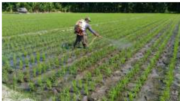
Gambar 9. Penyemprotan Pupuk

Setelah penanaman, maka kegiatan selanjutnya penyemprotan pupuk yang dilakukan sesuai dengan jadwal (time schedule), yang telah direncanakan pada tahap prototype. Gambar 9 berikut ini membuktikan kegiatan penyemprotan pupuk sesuai dengan jadwal yang telah ditetapkan pada tahap prototype.