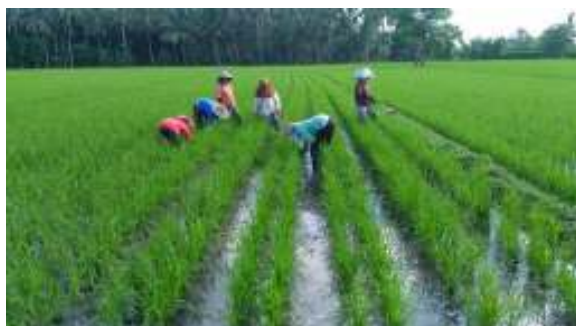
Gambar 10. Matun (Penyiangan Rumput)

Kegiatan penting lain yang dilakukan adalah penyiangan rumput/gulma, atau istilah yang umum digunakan oleh petani adalah matun. Gambar 10 ini menunjukkan kegiatan matun atau penyiangan rumput.