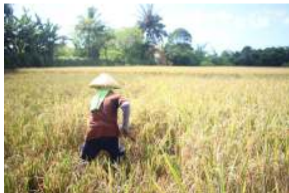
Gambar 11. Panen Padi

Dan kegiatan terakhir adalah panen padi, yang dilakukan pada usia 95 hari setelah tanam. Kegiatan panen ini lebih cepat dari jadwal yang ditetapkan, karena pada bulan Mei 2019 suhu di wilayah sekitar desa Badean panas, sehingga proses pematangan bulir padi lebih cepat dari teori umur pematangan bulir yaitu 110 – 115 hari setelah tanam. Gambar 10 ini menjelaskan proses pemanenan yang dilakukan secara manual.