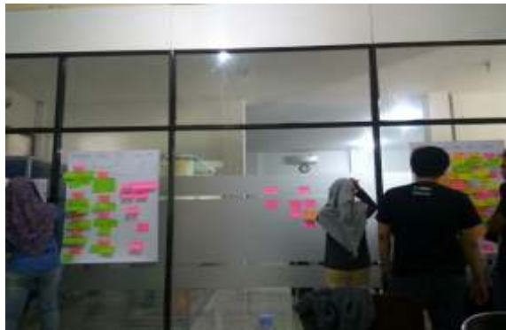
Gambar 6. Tahapan Decide (Putuskan)

Tahapan yang ketiga adalah tahap decide (memutuskan). Tujuan utama tahap ini adalah memutuskan mana masalah utama yang dihadapi petani dan mana solusi utama yang dirumuskan oleh tim. Untuk selanjutnya, hasil keputusan permasalahan dan solusi utama inilah yang akan dieksekusi menjadi prototype produk startup. Gambar 6 ini menunjukkan proses memutuskan masalah terbanyak dan solusi utamanya.