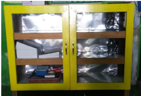
Gambar 2 Hasil rancangan alat pendingin kue lapis

Teknologi yang diberikan pada kegiatan pengabdian masyarakat yang di Kelompok Usaha “ ASIH” Dusun Kwasen adalah perancangan alat pendingin kue lapis dengan menggunakan Double Fan . Alat pendingin kue lapis ini terdiri dari dua pintu dengan dua kipas dengan setiap pintu memiliki susunan rak yang berfungsi untuk membagi kerja agar dapat disesuaikan dengan jumlah pesanan yang diterima, serta proses produksi mampu berjalan dalam dua pekerjaan sehingga dapat mempercepat proses yang dihasilkan dari 2 mesin motor penggerak yang dapat diputar sesuai kebutuhan.