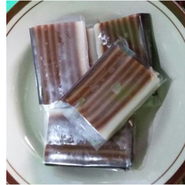
Gambar 5.3 Hasil produksi kue lapis

Perpindahan angin yang masuk dari luar alat akan disaring melalui filter untuk mencegah kotoran, baling-baling akan menghembuskan angin melewati rak-rak berlubang sehingga proses pendinginan dapat merata kesemua rak dalam alat pendingin. Setelah dilakukan uji coba dengan alat pendingin ini proses pendinginan kue lapis dapat dipercepat menjadi 3 jam artinya alat ini berhasil memberikan kontribusi mempercepat proses pendinginan sebesar 50%. Berikut adalah hasil kue lapis yang dihasilkan :