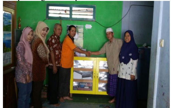
Gambar 3 Penyerahan alat pendingin kue lapis

Tim Pengabdian Masyarakat UPN Veteran Yogyakarta menyerahkan alat pendingin kue lapis :