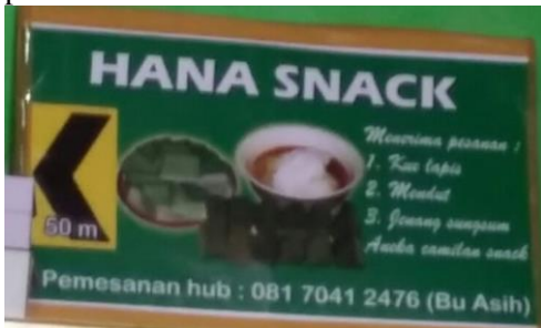
Gambar 7 Papan penunjuk arah

Tim juga membuat papan pengenalan dan penunjuk arah kepada kelompok usaha yang berfungsi selain sebagai alat promosi juga memberikan kemudahan kepada masyarakat untuk menemukan lokasi usaha dan melakukan pemesanan.