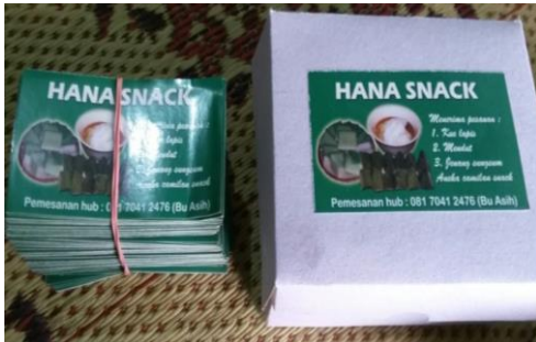
Gambar 6 Pembuat Merk Dagang “HANA SNACK”

Untuk mendukung identitas usaha dan pengenalan produk hasil usaha kepada masyarakat maka tim pengabdian UPN Veteran Yogyakarta juga dibuatkan merk dagang yang diberi nama HANA SNACK