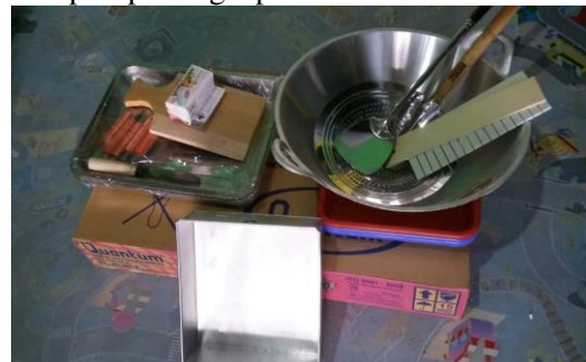
Gambar 5 Dukungan alat penguatan produksi

Hasil produksi yang dibuat biasa dipesan masyarakat untuk keperluan berbagai hajatan seperti pamit haji, pengajian, dan lain sebagainya. Untuk keperluan penguatan kemampuan produksi maka dalam kegiatan pengabdian ini juga diberikan kelengkapan penguatan produksi meliputi perlengkapan masak.