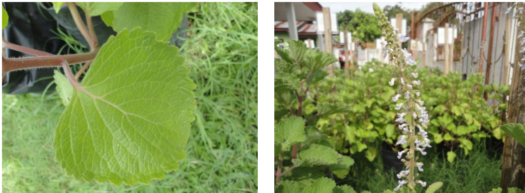
Gambar 1. Daun dan bunga tanaman bangun-bangun

Tanaman bangun-bangun yang berada di beberapa daerah dengan ketinggian berbeda antara lain Padang (rendah), Payakumbuh (sedang), dan Padang Panjang (tinggi) diidentifikasi morfologi batang, daun, bunga, dan akarnya.