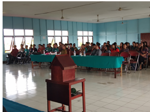
Gambar 1. Foto Kegiatan Seminar

Oleh karena itu, dalam isi ceramah yang disampaikan kepada para mahasiswa dan dosen, ditekankan kembali kepada pihak manajemen pengelola dan semua dosen perlu dibangkitkan motivasi dan antusiasme yang tinggi untuk memahami lebih mendalam mengenai sejumlah aplikasi teknologi media sosial. Pemahaman ini sangat penting agar dapat memberdayakan aplikasi media sosial untuk setiap aktivitas proses belajar mengajar dalam meningkatkan prestasi akademik mahasiswa (gambar 1).