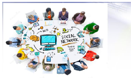
Gambar 3. Foto Kolaborasi Melalui Media Sosial

Untuk hasil penelitian terkait dengan topik media sosial dan prestasi mahasiswa, memperlihatkan ternyata belum semua mahasiswa memiliki pemahaman memanfaatkan media sosial meningkatkan prestasi belajarnya. Sebagian besar masih untuk kebutuhan menjalin hubungan sosial, pertemanan, hiburan, dan chatting. Namun demikian, satu hal yang cukup signifikan adalah meningkatnya keinginan untuk mulai merekomendasikan kepada teman kuliah lainnya menggunakan media sosial melakukan kolaborasi dan berbagi materi perkuliahan, diskusi group secara virtual dan penyampaian hasil pembahasan studi kasus dengan dosen pengampu mata kuliah [19]. Inisiasi usulan dari rekomendasi hasil penelitian mencerminkan sudah ada niat dan keinginan melakukan perubahan dalam proses pembelajaran bagi semua mahasiswa dan dengan dukungan dan keterlibatan peran aktif dari semua dosen menerapkan media sosial dalam meningkatkan prestasi akademik mahasiswa (gambar 3).