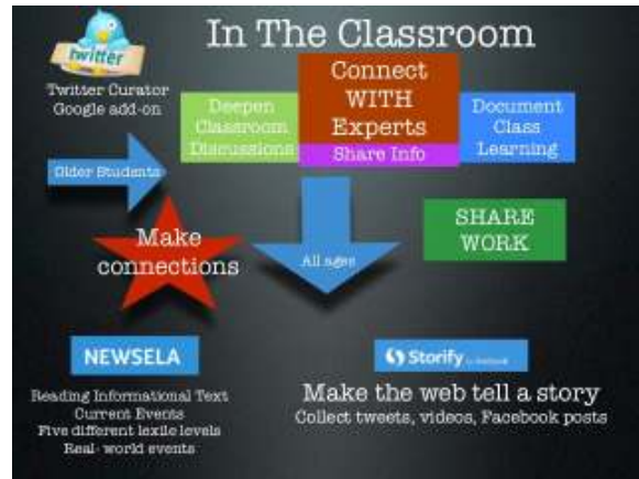
Gambar 4. Foto Model Ruang Kelas Virtual

Pemanfaatan media sosial untuk kebutuhan akademik melalui ruang kelas virtual dapat diawali menerapkan aplikasi facebook. Mengingat aplikasi facebook paling banyak digunakan dari kalangan mahasiswa. Kondisi ini dicerminkan penelitian sebelumnya, dimana platform facebook sudah banyak digunakan untuk pengajaran dan pembelajaran [32]. Jumlah penggunaan yang banyak dan dukungan studi empiris sebelumnya memperlihatkan facebook sangat sesuai untuk kebutuhan pembentukan ruang kelas virtual karena diskusi kelas dapat disajikan lebih interaktif dengan metode pembelajaran kolaboratif, efektif menyampaikan materi dalam bentuk konten video tutorial, fleksibel mengembangkan digital pembelajaran, berbagi sumberdaya dan pembelajaran mandiri [32]. Bahkan dominasi aplikasi facebook sudah menggeser dan menggantikan sistem manajemen pembelajaran pada saat ini dan mendatang. Tercatat telah sebanyak 43% pengguna sudah beralih ke aplikasi facebook dan tinggal hanya 12% masih bertahan yang menggunakan sistem manajemen pembelajaran [33].