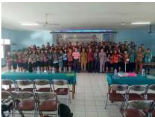
Gambar 6. Foto Bersama Penutupan Seminar

Pada hakekatnya, peserta seminar yang dihadiri oleh mahasiswa dan dosen memiliki antusiasme yang sangat tinggi karena pengetahuan ini sangat penting bagi mereka memberdayakan pemanfaatan media sosial dalam perkuliahan dan kehidupan sehari-hari. Semua peserta sangat mengapresiasi kegiatan seminar ini, selain menambah pengetahuan teknologi informasi khususnya teknologi media sosial juga memfasilitasi penerapannya dalam mewujudkan ruang kelas virtual. Kegiatan diskusi dibuka dalam tiga sesi oleh moderator dan sesuai dengan batasan waktu yang dialokasikan dan setiap sesi dibatasi tiga pertanyaan saja. Terakhir, sesuai dengan alokasi waktu yang sudah ditetapkan maka kegiatan pengabdian kepada masyarakat ini ditutup oleh salah satu pimpinan STT Pontianak dan dilanjutkan dengan foto bersama dengan semua pimpinan STT Pontianak (gambar 6).