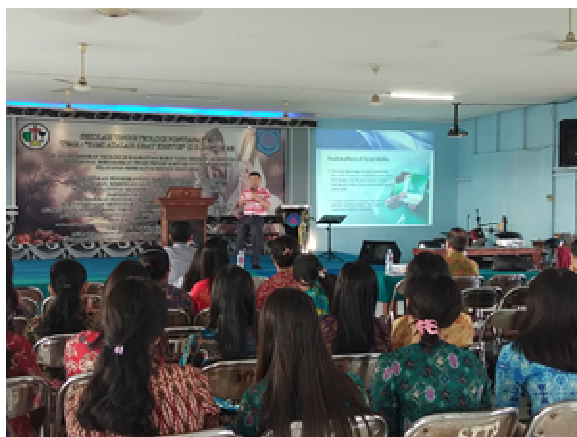
Gambar 2. Foto Pemaparan Materi Media Sosial

Untuk mempermudah pemahaman penggunaan aplikasi media sosial kepada peserta seminar, juga dipaparkan mengenai efek positif dan negatifnya. Dampak positif media sosial diantaranya sarana promosi, membuat grup atau komunitas untuk bertukar informasi, memperluas pertemanan, dan meremajakan kembali hubungan tali persaudaraan. Sementara sisi negatif, diantaranya dapat menimbulkan kecanduan dan mengabaikan kegiatan lainnya termasuk aktivitas belajar, munculnya sejumlah kasus hoax, penipuan, budaya malas, sikap egois, dan tidak lagi memiliki perhatian dengan lingkungan. Pemaparan mengenai dampak penggunaan media sosial setidaknya dapat memberikan kejelasan kepada pihak manajemen perguruan tinggi agar dalam menerapkannya dapat mencapai tujuan yang diharapkan (gambar 2).