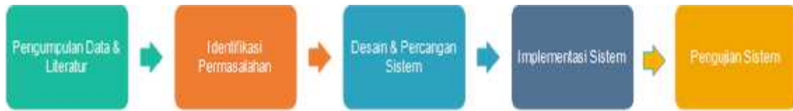
Gambar 1 Tahapan Rancangan Penelitian

Pada penelitian ini penulis melakukan penelitian tentang “Desain Perangkat Lunak SMS dengan Translasi Text Aksara Bali”. Secara umum tahapan rancangan penelitian yang akan dilakukan dapat dilihat pada gambar 2 berikut :