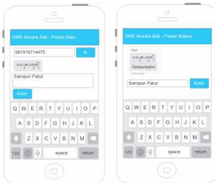
Gambar 6 Perancangan Proses Menerima SMS

Gambar 6 di atas menunjukkan desain dari translasi text Latin ke Aksara Bali pada perangkat lunak SMS. Pada sisi pengirim pesan yang diketik dalam text Latin langsung ditranslasikan ke dalam text Aksara Bali dan ditampilkan ke layar. Sedangkan pada sisi penerima, isi pesan yang diterima dalam bentuk text Latin juga langsung ditranslasikan ke dalam text Aksara Bali.