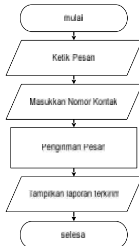
Gambar 4 Perancangan Proses Pengiriman SMS

Pada proses pengiriman SMS pada gambar 4 di atas terdapat beberapa tahapan. Tahapan dimulai dengan pengetikan pesan SMS pada kotak inputan pesan. Tahapan berikutnya adalah memasukkan nomor kontak tujuan pesan pada inputan nomor tujuan. Pesan yang telah diketik sebelumnya kemudian dikirimkan ke nomor tujuan. Setelah pengiriman pesan berhasil maka akan ditampilkan laporan pengiriman pesan.