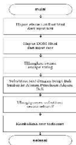
Gambar 3 Perancangan Proses Translasi Text Aksara Bali

Adapun perancangan dari proses translasi secara garis besar dapat dijabarkan pada gambar 3 berikut :