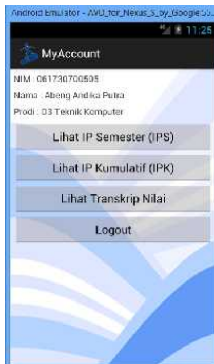
Gambar 3 Menu Utama Aplikasi Android

Menu ini merupakan daftar layanan informasi yang disediakan oleh aplikasi Android. Pada bagian atas halaman, terdapat informasi user yang melakukan login ke dalam sistem. Sedangkan pada bagian bawah terdapat beberapa menu yang diwakili menggunakan tombol, seperti layanan lihat indeks prestasi semester (IPS), lihat indeks prestasi kumulatif (IPK), dan lihat transkrip nilai seperti diperlihatkan pada Gambar 3. Pada bagian paling bawah terdapat sebuah tombol untuk keluar dari aplikasi. Jika tombol Logout ini ditekan, maka aplikasi akan menampilkan kembali halaman login.