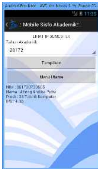
Gambar 4 Menu Lihat IP Semester

Menu ini digunakan untuk melihat indeks prestasi pada tahun akademik dan semester tertentu. Untuk mengaktifkan layanan ini cukup dilakukan dengan menekan tombol Lihat IP semester pada halaman menu utama, selanjutnya akan ditampilkan halaman seperti Gambar 4. Pada bagian atas halaman lihat IP semester terdapat spinner atau combobox yang menampilkan pilihan tahun akademik dan semester yang dapat dipilih oleh user untuk melihat informasi IP semester. Pada bagian bawah terdapat tombol Tampilkan untuk menampilkan informasi IP semester. Kemudian untuk kembali ke halaman menu utama cukup dilakukan dengan menekan tombol Menu Utama.