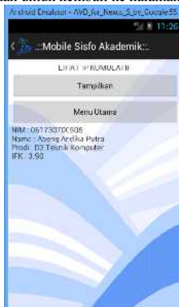
Gambar 5 Menu Lihat IP Kumulatif

Halaman Lihat IP kumulatif digunakan untuk menampilkan informasi indeks prestasi kumulatif yang telah dicapai oleh seorang mahasiswa selama mengikuti perkuliahan. Halaman lihat IP kumulatif dapat dilihat seperti Gambar 5. Cukup dengan mengklik tombol Tampilkan, maka informasi IPK ditampilkan pada bagian bawah aplikasi. Sedangkan terdapat tombol Menu Utama yang jika ditekan digunakan untuk kembali ke halaman menu utama.