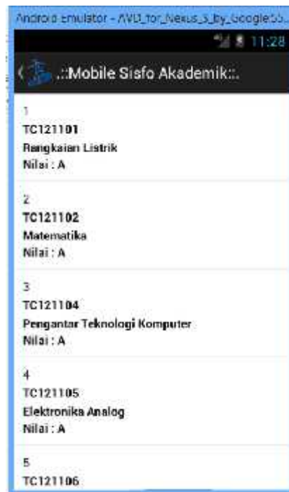
Gambar 6 Halaman Transkrip Nilai

Menu ini digunakan untuk melihat daftar transkrip nilai yang terdiri dari informasi kode, nama matakuliah dan nilai yang diperoleh. Informasi halaman transkrip nilai dapat dilihat pada Gambar 6. Pada bagian kiri atas terdapat satu buah tombol berupa anak panah menghadap ke kiri (<) yang digunakan untuk kembali ke halaman menu utama.