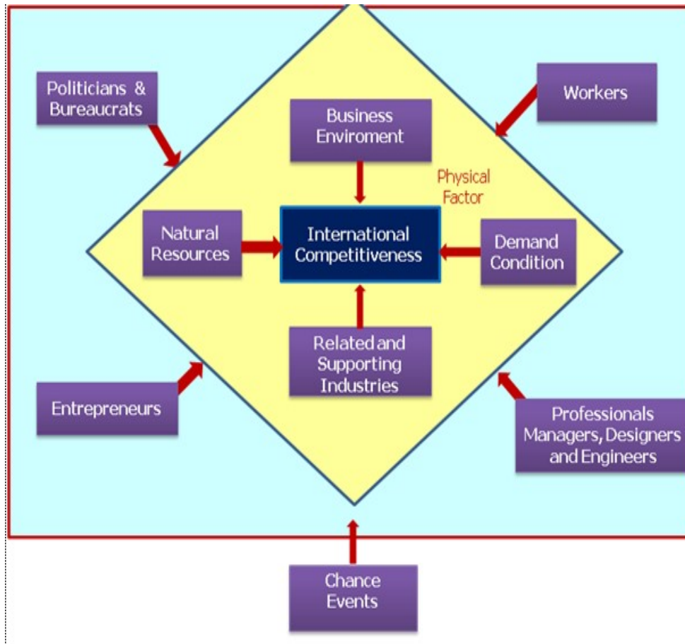
Gambar 2. Model Faktor Dong Sung Cho