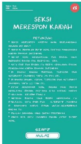
Gambar 5 Halaman Petunjuk Pengerjaan Soal

Halaman petunjuk pengerjaan soal dalam aplikasi android ini berisi petunjuk untuk mengerjakan soal-soal pada seksi merespon kaidah. Selain itu, ada pula petunjuk pengerjaan soal seksi membaca jika pada menu sebelumnya menekan menu “seksi membaca”. Setelah pengguna membaca petunjuk pengerjaan soal maka dibawahnya ada menu “mulai”. Menu “mulai” jika ditekan artinya pengguna memulai dalam pengerjaan soal-soal tersebut. Ada pula menu di pojok kanan atas jika pengguna akan keluar dari aplikasi ini.