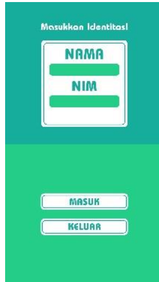
Gambar 2 Halaman Menu Utama

Halaman menu utama dalam aplikasi ini pengguna diminta untuk memasukkan identitas yang terdiri atas nama dan nim. Setelah memasukkan identitas maka pengguna baru bisa masuk ke halaman selanjutnya. Apabila menu “masuk” ditekan maka aplikasi akan menuju ke halaman selanjutnya yaitu halaman pilihan soal.