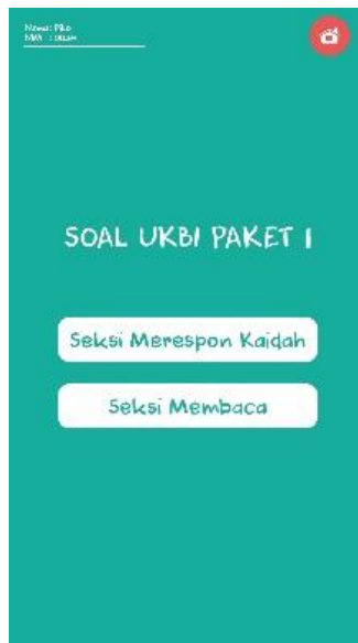
Gambar 4 Halaman Pilihan Seksi

Halaman pilihan seksi dalam aplikasi ini yaitu pengguna bisa memilih seksi merespon kaidah atau seksi membaca. Isi dari soal seksi merespon kaidah berisi soal-soal yang berhubungan dengan ejaan bahasa Indonesia, sedangkan soal membaca berisi soal-soal yang berhubungan dengan bacaan yang ditampilkan. Apabila menu “seksi merespon kaidah” ditekan maka pengguna akan menuju ke soal merespon kaidah. Selain itu, pada menu ini pula ada menu di pojok kanan atas jika pengguna akan keluar dari aplikasi ini.