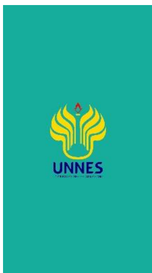
Gambar 1 Halaman Pembuka