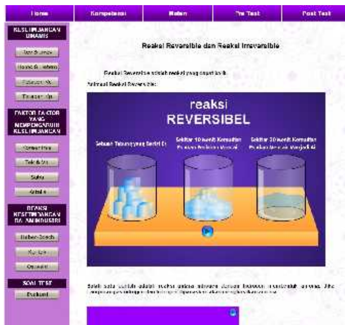
Gambar 5. Tampilan contoh isi materi.

Tampilan neraca di tampilan awal merupakan salah satu contoh simbol dari kesetimbangan kimia. Didalam tampilan materi ini berisikan dua belas sub menu yang dapat disesuaikan dengan kebutuhan pendidik dalam menyampaikan materi yang diampuh. Sebelas sub menu merupakan materi dan satu sub menu merupan evaluasi dari seluruh materi yang disampaikan. Untuk isi dari halaman materi ini pada masing-masing pertemuan dibuat menjadi symbol button untuk dapat difungsikan sebagai penghubung halaman isi materi pada masing-masing pertemuan, untuk contoh tampilan isi materi dapat dilihat pada gambar.