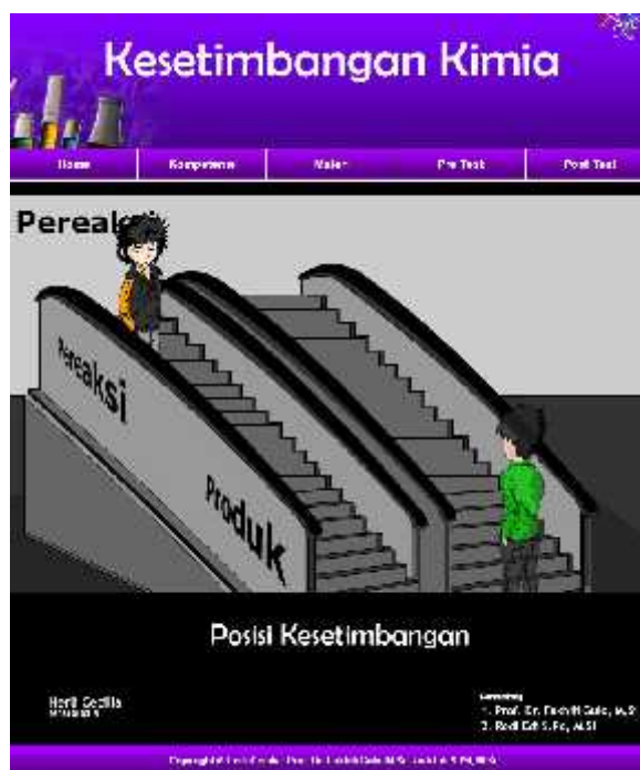
Gambar 2. Tampilan interface multimedia website .