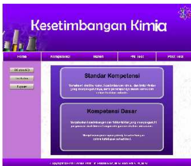
Gambar 3. Tampilan tujuan pembelajaran.

Di dalam tampilan tujuan pembelajaran ini berisikan tentang tujuan yang akan dicapai dalam materi yang akan disampaikan, dengan memenuhi kompetensi peserta didik dengan acuan kurikulum masing-masing mata pelajaran yang diampuh oleh pendidik dan tenaga kependidikan. Tampilan tujuan pembelajaran ini berisikan menu, setiap menu terdiri dari sub menu yang menjelaskan tentang standar kompetensi dan kompetensi dasar, indikator dan tujuan dari materi kesetimbangan yang dibuat dan dimasukkan ke dalam multimedia website .