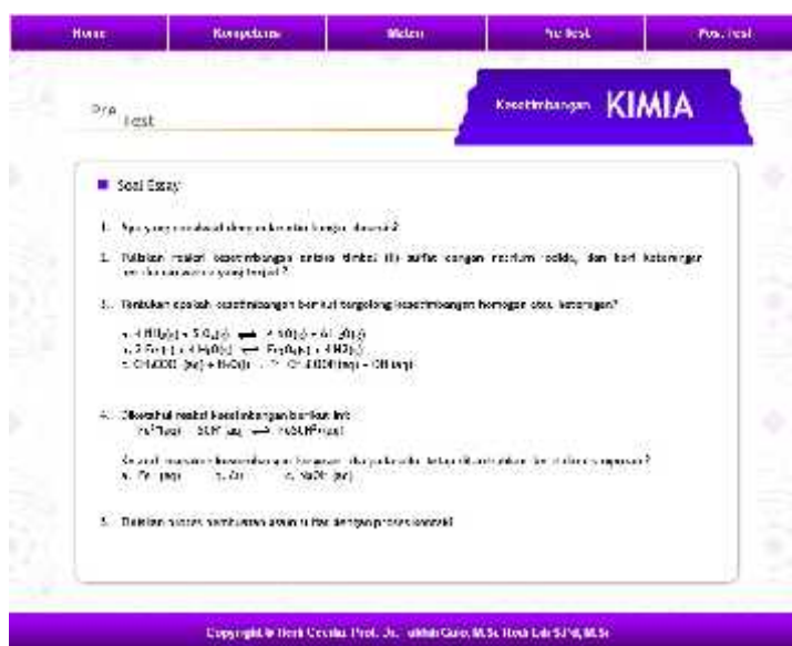
Gambar 6. Tampilan evaluasi.

Di dalam tampilan evaluasi ini berisikan evaluasi pembelajaran selama proses belajar yang dapat dipersiapkan oleh pendidik dan tenaga kependidikan. Dapat juga berupa soal-soal pembelajaran dengan