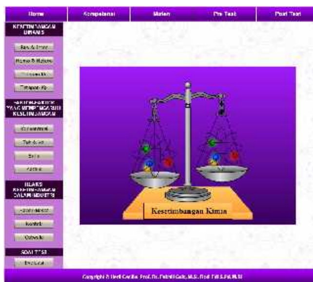
Gambar 4. Tampilan tujuan pembelajaran.