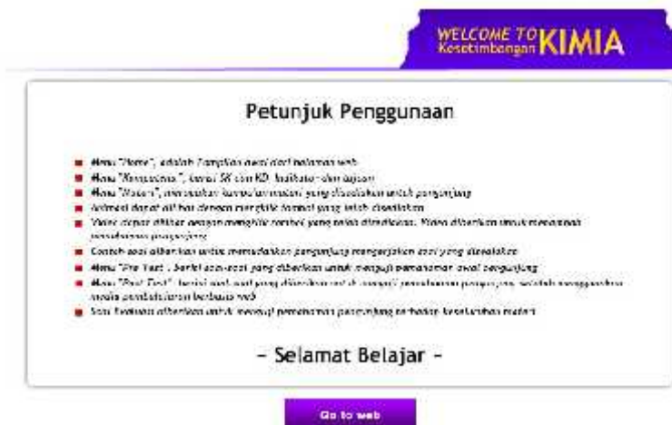
Gambar 2. Tampilan petunjuk penggunaan aplikasi .

Tampilan petunjuk penggunaan aplikasi, tampilan ini memudahkan siswa untuk mengerti proses dari setiap menu yang ada di multimedia website . Selain mempermudah para siswa tampilan ini juga menjelaskan fungsi dari menu yang ada di multimedia website .