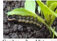
Gambar 2. Ulat grayak ( Spodoptera litura )