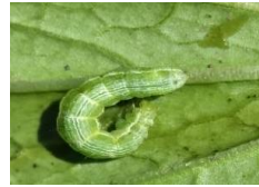
Gambar 1.. Ulat tritip ( Plutella xylostella )

Pengamatan saat tanaman sawi berumur 14 tanaman sawi diserang oleh ulat grayak ( Spodoptera litura ), ulat tritip ( Plutella xylostella ) dan ulat tanah hitam Agrotis ipsilon (Gambar 1, 2 dan 3).