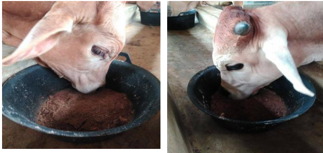
Gambar 3. Pemberian pakan silase komplit berbasis pelepah sawit dan indigofera

Ransum yang diberikan adalah ransum perlakuan. Ransum perlakuan diberikan ad libitum. Sisa ransum yang diberikan ditimbang keesokan harinya untuk mengetahui konsumsi pakan ternak tersebut. Pemberian air minum diberikan secara tidak terbatas. Air minum diganti setiap hari dan tempatnya dicuci dengan air bersih.