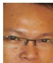
Gambar 7. Kontak mata atau pergerakan mata

Dalam pertunjukan sulap klasik ini juga "Ray Antylogic" menampilkan beberapa kontak mata atau pergerakan mata di wajah "Ray Antylogic" yaitu :