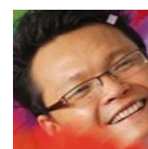
Gambar 1. Ekspresi Bahagia

Dalam pertunjukan sulap klasik yang ditampilkan oleh "Ray Antylogic" terdapat beberapa ekspresi wajah yang paling dominan, yaitu :