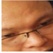
Gambar 8. Kontak mata atau pergerakan mata

Pada gambar 8. pergerakan mata ke atas dan ke kiri hal tersebut dapat diartikan sang pesulap sedang mencoba membayangkan sesuatu yang terjadi sebelumnya. Hal ini dapat menggambarkan bahwa pertunjukan sulap klasik adalah satu kesatuan dari semua permainan sulap klasik dalam pertunjukan tersebut. Sang pesulap tidak hanya memikirkan bagaimana pesan kinesik tersebut disampaikan namun juga bagaimana kinesik itu sendiri dapat dimengerti dengan mudah oleh penonton. Memikirkan bagaimana reaksi penonton dalam permainan sebelumnya dapat menjadi acuan untuk permainan selanjutnya.