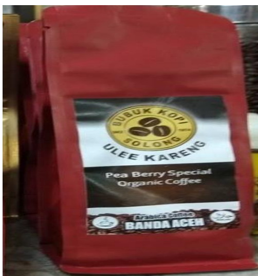
Gambar 2. Kopi Arabika Solong Ulee Kareng

Populasi dalam penelitian adalah kopi bubuk arabika. Sampel yang digunakan adalah satu bungkus bubuk kopi arabika produksi Solong Ulee Kareng yang diambil secara sengaja sesuai dengan persyaratan sampel yang diperlukan yaitu kopi bubuk hitam bermerek jenis arabika Solong Ulee Kareng yang dapat dilihat pada Gambar 2.