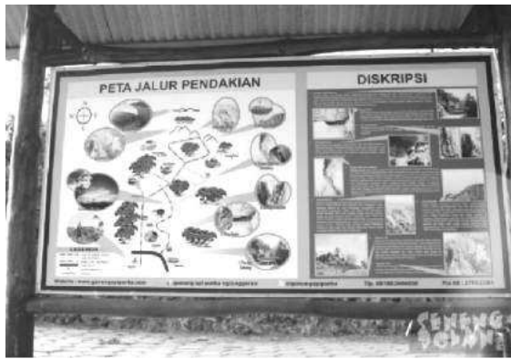
Gambar 3: Tindakan encouragement dengan peta destinasi (dokumentasi, 2017)