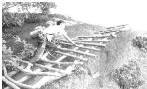
Gambar 1: Pembangunan Tangga Pendakian dengan Desain Lokal

Upaya enforment dilakukan dengan penambahan talut di beberapa area yang bentang alamnya miring untuk mencegah bahaya longsor. Upaya penguatan juga bertujuan untuk memperkuat kondisi