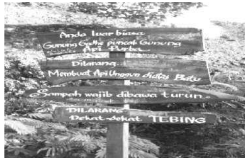
Gambar 2: Trend desain papan keselamatan dengan desain local (dokumentasi, 2017).

Simbol-simbol dan papan peringatan yang telah dibuat pengelola ditujukan untuk memberi edukasi diantaranya : penyediaan rambu petunjuk, papan informasi, peringatan, papan larangan, dan sebagainya yang dibuat berbasis lokalitas. Prinsip CBT yang menekankan lokalitas sebagai acuan dalam membangun segala unsur produk wisatanya.