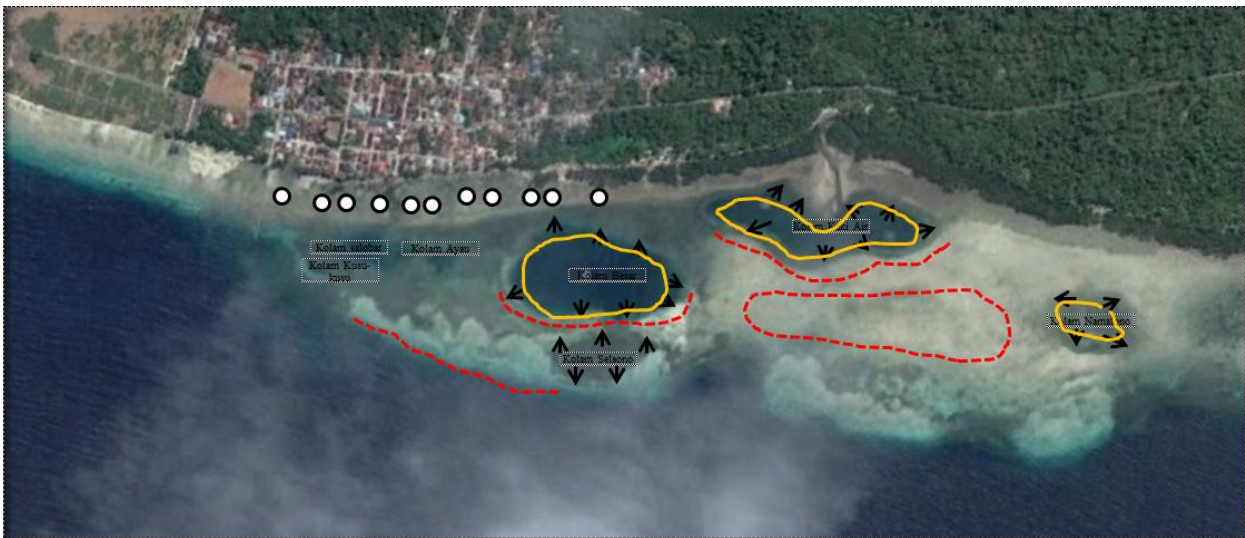
Gambar 3. Aktivitas penangkapan ikan