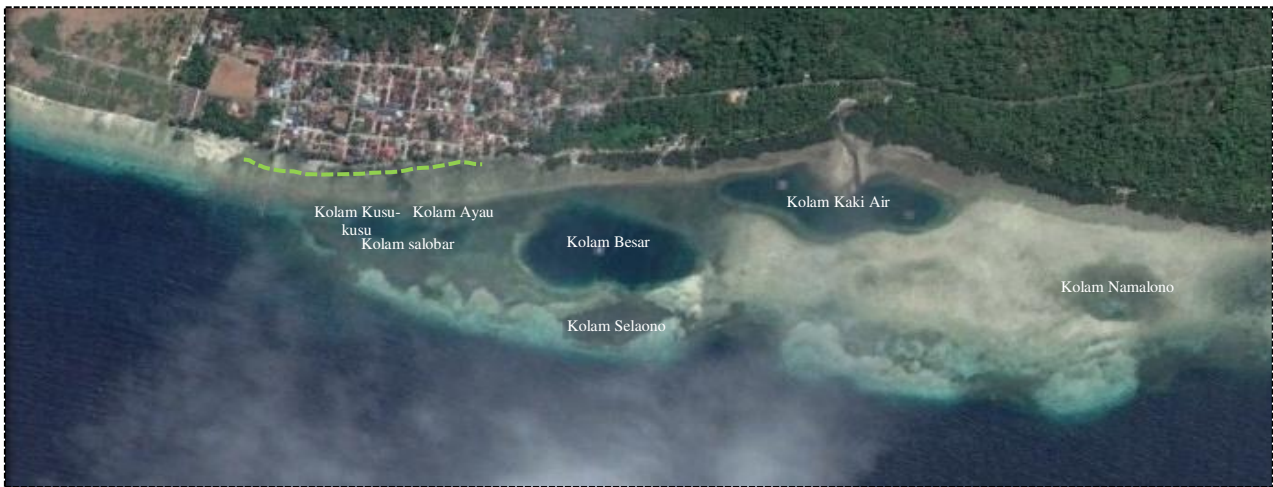
Gambar 4. Aktivitas pembuangan sampah