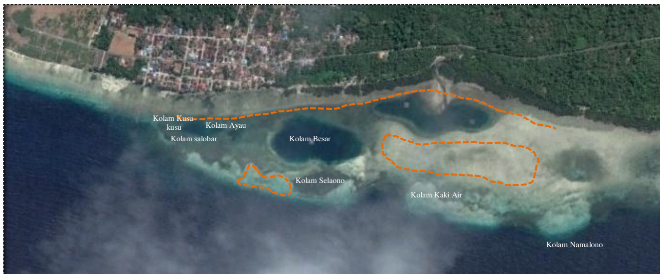
Gambar 2. Aktivitas bameti

Hal ini didukung dengan jawaban masyarakat bahwa telah terjadi perubahan ukuran hasil tangkapan sumberdaya dan jumlah jenis sumberdaya yang tertangkap. Ukuran hasil tangkapan sumberdaya dalam 5 – 10 tahun terakhir semakin menurun dan kecil. Sedangkan untuk atribut jumlah jenis sumberdaya yang tertangkap, masyarakat menjawab ada cukup banyak jenis lain yang juga turut tertangkap.