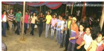
Gambar 4. 29 Busana Bebas Tari Lulo Dokumen (Majid 2019)

Busana bebas yang digunakan pada gambar di atas pada saat tarian Lulo, biasanya dipakai pada saat tarian Lulo di acara pesta. Hal ini sudah menjadi tradisi masyarakat Tolaki khususnya dan masyarakat kota Kendari pada umumnya. Sedangkan tata rias yang mereka gunakan biasanya riasan seadanya tanpa harus memperhatikan kesesuaian dengan kostum yang digunakan.