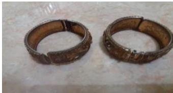
Gambar. 15 Gelang

Gambar di atas merupakan salah satu aksesoris pada busana tari Lulo. Eno-eno yang melingkar di leher sebagai pelengkap dan pemanis yang berarti rasa persatuan dan kekeluargaan.