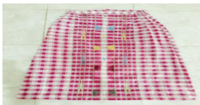
Gambar 4. 17 Sarung Tenun Tolaki Dokumen (Majid 2019)

Gambar di atas merupakan busana tari Lulo suku Tolaki untuk wanita. Baju tersebut dinamakan Babu nggawi (baju tidak terbelah), yang sering disebut dengan babumbineboto artinya baju yang tidak terbelah pada bagian depannya seperti baju kebaya, akan tetapi hanya mempunyai lubang kepala yang terbelah sampai bagian atas dada. Hiasan pada baju yang terletak pada pinggir baju disebut juda dengan babumbinarahi . Warna pada baju nggawi cenderung menggunakan warna terang seperti yang terlihat pada gambar di atas yaitu warna orans.