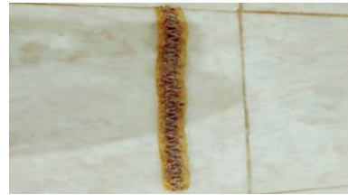
Gambar 4. 12 Destar (Ikat Kepala) Dokumen (Majid 2019)

Gambar di atas adalah gambar hiasan Sanggul yang merupakan hiasan kepala pada tata rias tari Lulo, yang berbentuk daun sirih pinang yang berwarna merah sebagai lambang kekeluargaan.