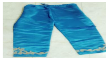
Gambar 4. 21 Saluaro (celana panjang) Dokumen (Majid 2019)

Gambar di atas adalah merupakan baju atau busana pada penari Lulo suku Tolaki yang disebut dengan babu kandiu atau baju pria. Babu kandiu merupakan baju lengan panjang dengan model kerah berdiri yang terbuka pada bagian depannya, berwarna biru dihiasi warna keemasan pada sekitar leher, belahan baju depan serta bagian lengan.