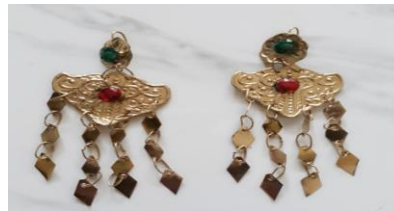
Gambar 4. 13 Andi-andi (Anting-anting) Dokumen (Majid 2019)

Gambar ikat kepala atau disebut dengan destar/usu ulu merupakan salah satu aksesoris pada tata rias tari Lulo pada masyarakat suku Tolaki. Hiasan kepala ini juga dipakai dengan cara dililit di kepala untuk mempercantik tampilan pada penari wanita dan juga memiliki bermacam-macam warna.