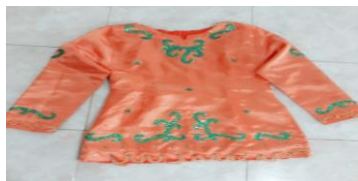
Gambar 4. 16

Babu Ngawi (Baju tidak terbelah)