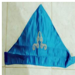
Gambar 4. 23 Pabele (topi)

membalut celana. Sarung yang membalut celana panjangnya hanya sampai di atas lutut. Pada pinggang sarung dikebat dengan sebuah ikat pinggang yang disebut sulepe atau salupi , sehingga lilitan sarung tidak mudah terlepas.