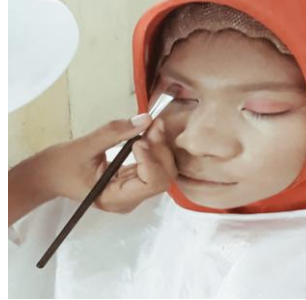
Gambar 4. 6 Pemakaian Eyeshadow Dokumen (Majid 2019)

Gambar di atas menunjukkan pemberian eyeshadow pada wajah dengan menggunakan warna pink dengan memakai kuas.