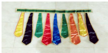
Gambar 4. 18 Tabere (ikat pinggang) Dokumen (Majid 2019)

Gambar sarung Tenun di atas merupakan salah satu pakain yang digunakan pada penari tari Lulo.