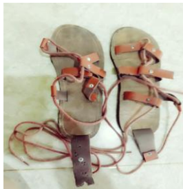
Gambar 4. 24 Kapinda (sandal)

Pabele atau topi yang diletakkan dikepala sebagai salah satu kelengkapan dari busana tari Lulo pria pada masyarakat Tolaki. Pabele terbuat dari bahan yang sama seperti bahan pada baju dan celana, dengan bentuk runcing pada bagian depan ujung atau puncaknya yang dihiasi manik-manik dan benang emas pada sekeliling pabele dan bagian lainnya.