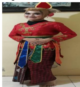
Gambar 4. 28

Gambar di atas menunjukkan penggunaan busana berwarna ungu sangat sesuai dengan tata rias yang digunakan, sebab warna kostum yang berwarna ungu sesuai dengan ayesedow yang digunakan yaitu warna ungu