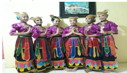
Gambar 4. 27

Kesesuaian busana dengan tata rias pada tari Lulo, sangat terlihat jelas pada gambar di atas. Penggunaan busana yang berwarna merah muda dengan aksesoris berwarna warni begitu menunjukkan keaneka ragaman budaya daerah tersebut. Warna merah muda yang digunakan pada busana tari Lulo, sesuai dengan tata rias yang digunakan yaitu dengan tampilannya yang natural, elegan, warna ayesedow warna merah muda dan warna lipsik juga merah muda yang disesuaikan dengan warna kostum yang dipakai yaitu merah muda