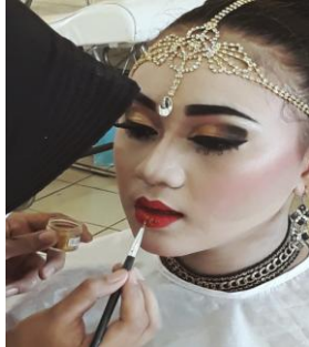
Gambar 4. 9 Pemakaian Lipsitk Dokumen (Majid 2019)

Tahap pemakaian lipstick, pemasangan konde adalah tahap terakhir dari rias wajah pada tari Lulo. Pemakaian listik juga masih menggunakan warna natural yang disesuaikan dengan warna eyeshadow yang digunakan yaitu warna pink.