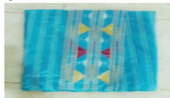
Gambar 4. 22 Sawu Ndolaki (Penutup Kepala) Dokumen (Majid 2019)

Pakaian atau busana pada pria khususnya saluaro atau celana panjang bentuknya agak sempit dan panjangnya hanya sampai pada buah betis, pada bagian luar ujung bawah terbelah.