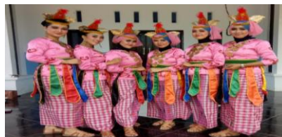
Gambar 4. 26

Kesesuaian Busana dan Tata Rias pada Upacara Adat Tari Lulo