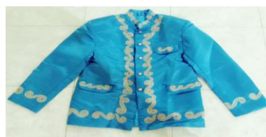
Gambar 4. 20 Babu Kandiu Dokumen (Majid 2019)

Gambar di atas adalah merupakan baju atau busana pada penari Lulo suku Tolaki yang disebut dengan babu kandiu atau baju pria. Babu kandiu merupakan baju lengan panjang dengan model kerah berdiri yang terbuka pada bagian depannya, berwarna biru dihiasi warna keemasan pada sekitar leher, belahan baju depan serta bagian lengan.