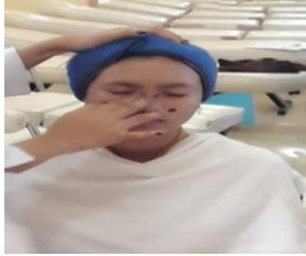
Gambar 4. 3 Pemakaian Alas Bedak Dokumen (Majid 2019)

Pertama-tama yang dilakukan pada proses tata rias wajah pada tari lulo adalah memakaikan alas bedak atau foundation pada wajah. Kemudian diratakan samapi menutupi seluruh pori-pori pada wajah. Biasanya alas bedak yang digunakan adalah alas bedak yang tidak mudah luntur dan tahan lama seperti Loreal.