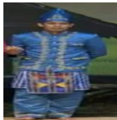
Gambar 4. 25 Busana Pria Pada Tari Lulo Dokumen (Majid 2019)

Selain pabele gambar di atas juga merupakan salah satu kelengkapan pakain penari Lulo suku Tolaki yaitu kapinda (sandal). Kapinda (sandal) digunakan oleh penari baik pria maupun wanita pada tari Lulo oleh masyarakat suku Tolaki Sulawesi Tenggara.