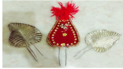
Gambar 4. 11 Hiasan Sanggul Dokumen (Majid 2019)

Gambar di atas merupakan gambar konde Halu Oleo. Konde Halu Oleo berbentuk simpul delapan yang digunakan. Selain itu ada juga tusuk Konde motif bunga yang disebut dengan yang merupakan salah satu hiasan kepala pada tata rias tari Lulo.