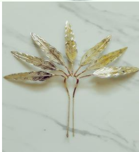
Gambar 4. 10 Konde Halu Oleo dan hiasan sanggul Dokumen (Majid 2019)

Gambar di atas merupakan gambar konde Halu Oleo. Konde Halu Oleo berbentuk simpul delapan yang digunakan. Selain itu ada juga tusuk Konde motif bunga yang disebut dengan yang merupakan salah satu hiasan kepala pada tata rias tari Lulo.