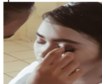
Gambar 4. 8 Pemakaian Bulu Mata (Foto Majid 2019)