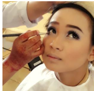
Gambar 4. 7 Pemakaian ayeshadow dan concealer

Untuk menghilangkan kantong mata atau mata panda yaitu dengan cara menggunakan concealer yang lebih terang dari foundation agar mata panda tersamarkan dengan sempurna. Pemilihan warna putih kekuningan sebagai warna dasar untuk mengatasi kantong mata.