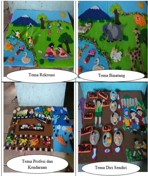
Gambar 1 Media Papan Flanel

diminta bertanya tentang isi cerita yang telah di ceritakan. dan penting untuk dapat memberi kesempatan pada satu atau dua orang anak untuk menceritakan kembali cerita tersebut. (Dhieni: 2011: 6.43-6.45)