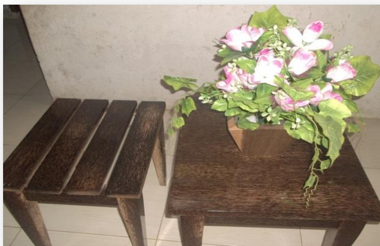
Gambar 2. Produk meubel dari kayu dengan menggunakan bahan pengawet tirmisida