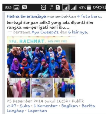
(Gambar 6. Beranda Facebook Hasna)

Menarik mengetahui apa-apa saja yang dilakukan Rahmawati dan rekan-rekannya sesama mahasiswa itu dengan akun facebooknya. Sembilan diantara mereka mengatakan menggunakan facebook seperti biasa, up date status, unggah foto, memantau status dan perkembangan terkini teman, dan terakhir berkomentar atau membalas komentar teman. Seperti yang disampaikan Hasna kepada peneliti: