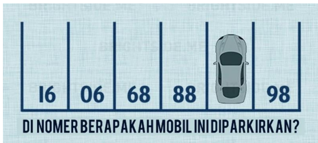
Gambar 1. Soal Level 1 dengan kasus mobil yang diparkir