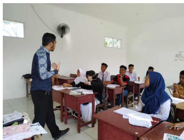
Gambar 7. Pengabdi juga memberikan motivasi bahwasannya siswa/i SKB Balikpapan Timur sangat hebat

Dalam pelaksanaannya pula, guru juga perlu memberikan soal-soal cerita yang berkaitan dengan permasalahan kehidupan sehari-hari, terlebih soal teka-teki logika. Rahardjo & Waluyati (Muncarno & Yulina, 2017) menyatakan bahwa secara garis besar kesulitan siswa dalam menyelesaikan soal cerita yaitu kesulitan dalam memahami masalah (soal), kesulitan dalam menyusun rencana penyelesaian, kesulitan dalam menyelesaikan rencana, kesulitan dalam melihat (mengecek) kembali hasil yang telah diperoleh, dan kesulitan dalam menginterpretasikan jawaban tersebut terhadap situasi permasalahan yang terdapat dalam soal.