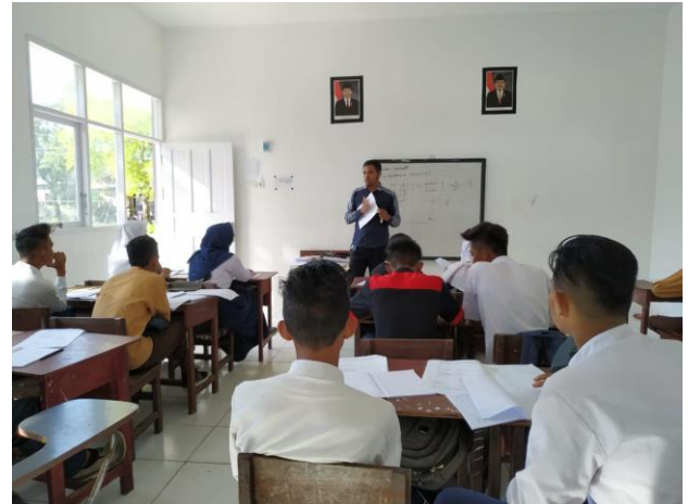
Gambar 4. Pengabdi memberi tantangan soal kepada siswa/i

Dengan logikanya, siswa tersebut menjelaskan secara sederhana, “mengapa 0? Hal ini karena yang ditanyakan adalah VOLUME GALIAN, bukan VOLUME TANAH”. Pengabdi pun mengapresiasi siswa tersebut dan serentak teman-teman sekelasnya memberikan tepuk tangan. Hingga saat ini, skor sementara adalah Pengabdi (1) dan Siswa (1). Imbang.