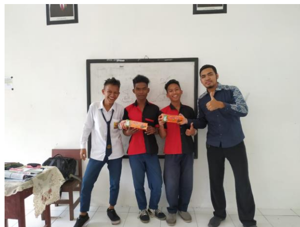
Gambar 6. Pengabdi memberikan reward

Skor akhir punimbang, Pengabdi (2) dan Siswa (2). Dari sini, Pengabdi sangat mengapresiasi logika berpikir para siswa/i dan terus memberi motivasi kepada mereka bahwasannya mereka ternyata juga mampu, tinggal sedikit lagi diasah kemampuannya. Pengabdi pun memberikan reward atas pencapaian mereka.