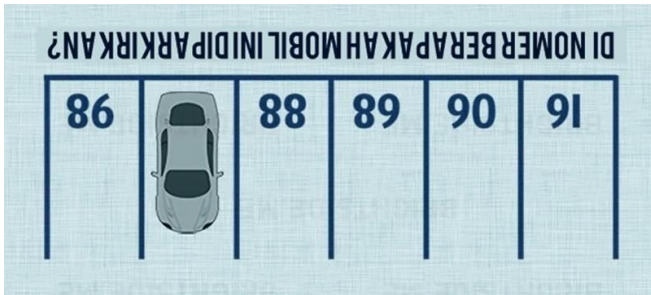
Gambar 3. Penyelesaian dari Soal Level 1 yang dibalik

Soal teka-teki logika matematika tersebut menunjukkan kondisi tempat parkir yang dinomori secara berurutan. Adapun jawaban “87” dikarenakan gambar tersebut tinggal dibalik (diputar 180°), sehingga menjadi seperti ini: